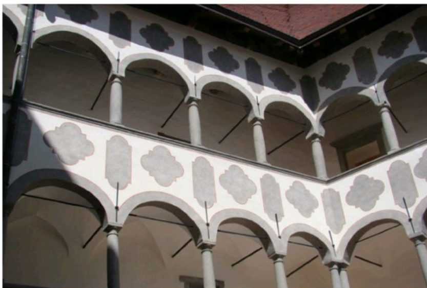
Veliki Tabor

važnije utvrde tako je i ova kroz svoje godine postojanja mijenjala vlasnike. Prvi zapisi govore da su ovdje stolovali grofovi Celjski, a nakon njihovog nestanka, utvrdu preuzima obitelj Ratkaj , koja joj daje današnji izgled i prepoznatljive kule. Zadnji poznati vlasnici bile su sestre Družbe Kćeri Milosrđa iz Blata na Korčuli, a 1950. upravljanje nad utvrdom preuzimaju Muzeji Hrvatskog zagorja .