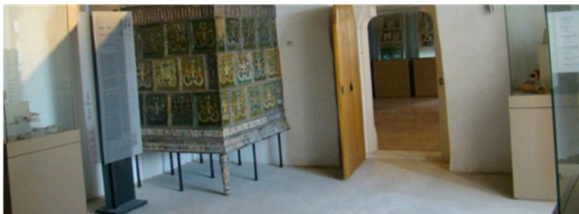
Galerija u utvrđi

Do Velikog Tabora , iz smjera Zagreba, može se doći autocestom A2 i to na dva načina. Prva mogućnost je da siđete na čvoru Zabok i vozite prema Tuhelju i nastavljate do Desnića. Nekoliko minuta nakon skretanja prema Desniću, vidjet ćete utvrdu kako se uzdiže na brdu . Druga mogućnost je da kod Zaprešića skrenete na cestu D1 do Velikog Trgovišća, pa preko Tuhelja dođete do Velikog Tabora .