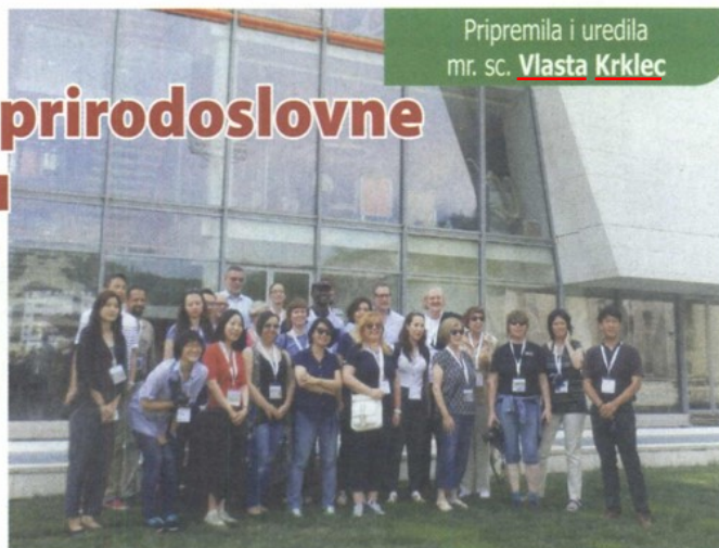
Pripremila i uredila mr. sc. Vlasta Krklec

sudjelovala na ovoj značajnoj konferenciji uz promociju i prezentaciju Muzeja krapinskih neandertalaca . U okviru stručne ekskurzije posjećene su prirodoslovne zbirke Sveučilišta u Torinu, te prirodoslovni muzeji MUSE u Trentu i u Bolzanu, gdje su čuva poznata mumija Ledenog čovjeka pronađenog u Alpama. Ove