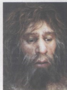
Neandertalci su bili puno napredniji nego što se smatralo

Kada su shvatili važnost svog pronalaska, speleolozi predvođeni 15-godišnjim dječakom, koji su prvi otkrili te kružne strukture, o svom su otkriću obavijestili arheologa Francois Rouzau-đa. Koristeći metodu radiokar-