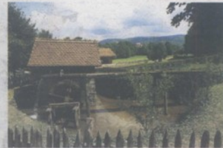
Mlin Stjepana Majseca posljednji je sačuvani mlin u ovome kraju: na samo tri kilometra od podnožja Sljemena do Donje Stubice bilo je 16 mlinova