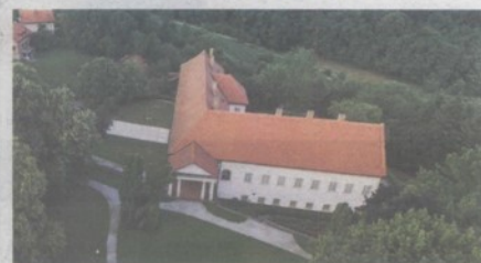
Dvorac Oršić u stubičkom kraju