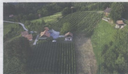
Panorama na Donju Podgoru Brežuljkasti zagorski krajolik s neizbježnim kletima i vinogradima