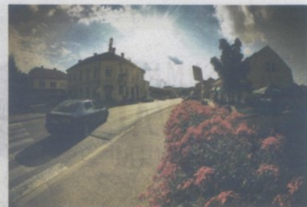
Sunce je rastjeralo stanovnike Donje Stubice s vrelog asfalta