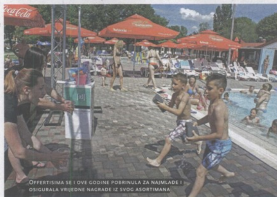
OFFERTISSIMA SE I OVE GODINE POBRINULA ZA NAJMLADE I OSIGURALA VRIJEDNE NAGRADE IZ SVOG ASORTIMANA