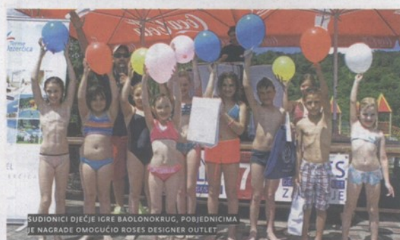
SUDIIONICI DJEČJE IGRE BAOLONOKRUG, POBJEDNICIMA JE NAGRADE OMOGUĆIO ROSES DESIGNER OUTLET