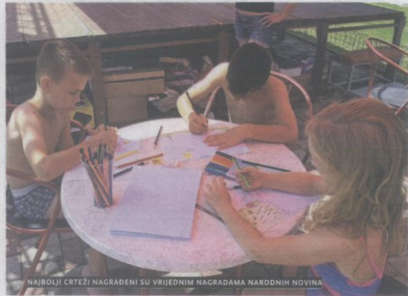
NAJBOLJI CRTEŽI NAGRADENI SU VRIJEDNIM NAGRADAMA NARODNIH NOVINA

Izdvojeni radovi s likovne radionice Narodnih novina