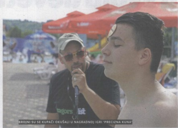
BROJNI SU SE KUPAČI OKUŠALI U NAGRADNOJ IGRI "PRECIZNA KUNA"