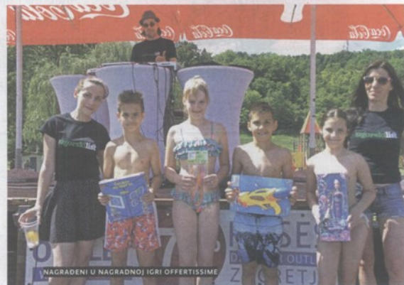
NAGRAĐENI U NAGRADNOJ IGRI OFFERTISSIME

Press CLIPPING d.o.o., tel.: +385 (0)1 / 3094804, e-mail: press@pressclip.hr, www.pressclip.hr Korisnik usluga ne smije dalje reproducirati i / ili distribuirati dostavljene mu Programske sadržaje medija bez posebnog odobrenja Nositelja prava (DZNAIP i HDS-ZAMP)