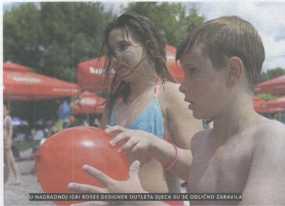
U NAGRADNOJ IGRI ROSES DESIGNER OUTLETA DJECA SU SE ODLIČNO ZABAVILA