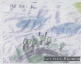
FILIP TRBIĆ, 8 GODINA