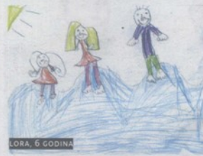
LORA, 6 GODINA