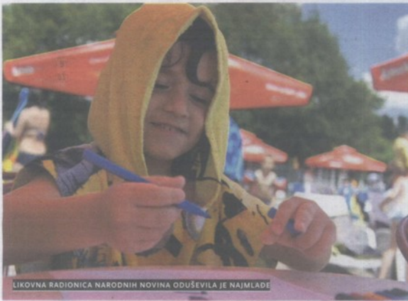
LIKOVNA RADIONICA NARODNIH NOVINA ODUŠEVILA JE NAJMLAĐE