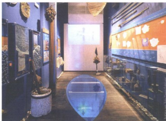
Rovinjska kuća o batani: vrijednost identiteta lokalne zajednice

pa do današnjice kad je ta djelatnost u izumiranju. Za ljubitelje vozila i tehnike svakako treba preporučiti odlično opremljeni Tehnički muzej u Zagrebu, u kojem je bogata zbirka koja objašnjava mnogo o evoluciji strojeva i znanstvenog razmišljanja u Hrvatskoj, ali i u svijetu. Tu je i Muzej automobila Ferdinand Budicki koji čuva odlično očuvane oldtimere, ali i ključne informacije o razvoju hrvatskog i svjetskog automobilizma. Idete li na izlete ili živite u gradovima u kojima su navedeni muzeji - posjetite ih.