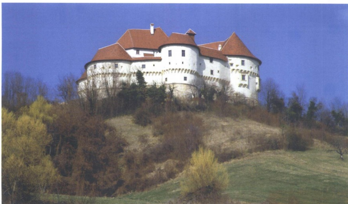
Dvorac Veliki Tabor jedan je od dragulja Hrvatskog zagorja

► posebnim. Ekomuzej pomaže lokalnom stanovništvu u ponovnom pronalaženju smisla vlastitog identiteta i otvaranja novih razvojnih mogućnosti. Ono što je izuzetna vrijednost ekomuzeja je djelovanje i stvaranje svijesti o cjelovitom i jedinstvenom pristupu baštini i održivu razvoju - kaže Milvana Arko-Pijevac. Umjesto naglasaka na muzejskim "trofejima", ekomuzeji su orijentirani na buđenje svijesti o vrijednosti identiteta lokalne zajednice putem edukacije o prirodnim i kulturnim znamenitostima te u centar postavljaju čovjeka i njegovo iskustvo. Vrlo uspješan i prvi primjer takvog muzeja u Hrvatskoj je Kuća o batani u Rovinju, koji pripovijeda priču o batani, drvenoj ribarskoj brodici i omiljenom rovinjskom tradicionalnom plovilu koje desetljećima grade lokalni brodotesari i kalafati. Kroz interaktivan postav posjetitelji se upoznaju i sa svakodnevicom života u Rovinju te s njegovim bogatim naslijeđem. Obje naše sugovornice kao jako dobar ekomuzej ističu i noviji Muzej betinske drvene brodogradnje,