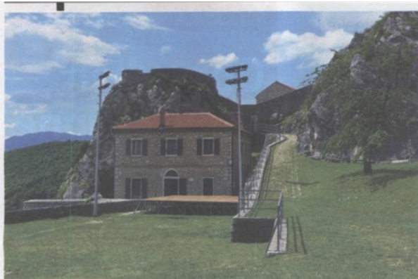
Jedan od muzejskih objekata na kninskoj tvrđavi