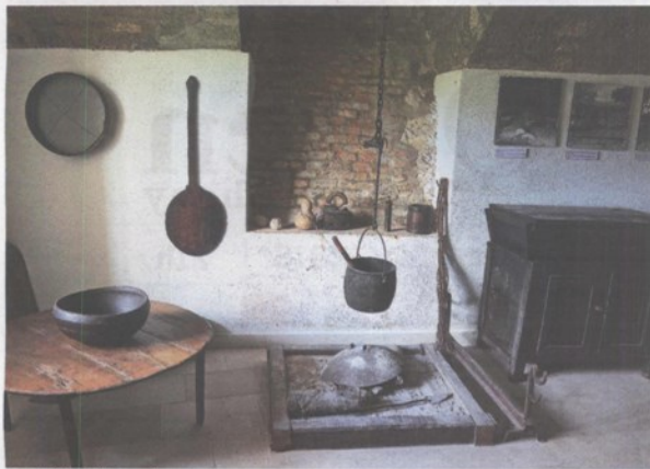
Etnološki odjel muzeja

TURISTI POHRLILI Kninski muzej i tvrđava s