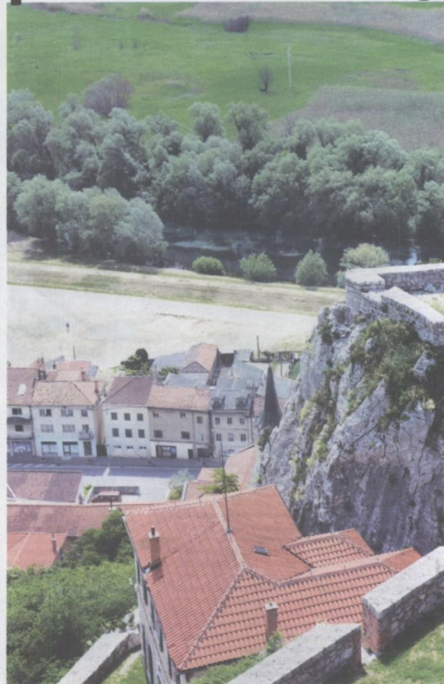
Pogled na zidine tvrđave