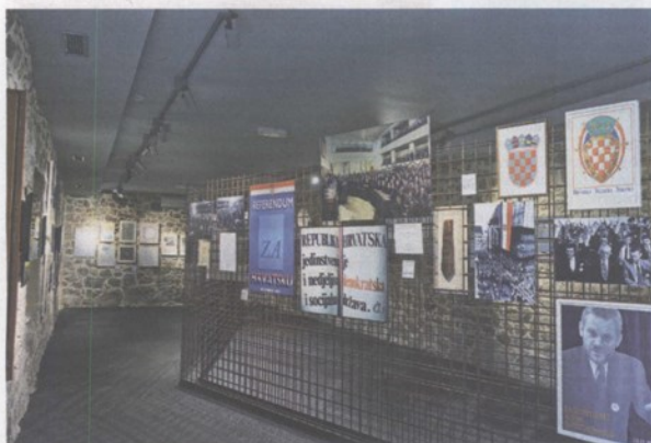
Dio postave u muzejskom odjelu Oluja