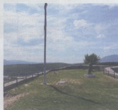
Plato na kojem se planiraju radovi na uređenju i s novim izgledom i sadržajima

U proslavu 100. godišnjice rođenja kninskog akademika, znanstvenika i humanista Hrvoja Požara uključit će se i Kninski muzej. Osim što Požar ima svoju spomen-sobu u muzeju, uskoro će dobiti i šetnicu koja će posjetitelje od zgrade stare gimnazije voditi prema tvrđavi. Na šetnici, koja se prijeđe za 20-ak minuta hodanja, bit će postavljeni informativni paneli s kraćim tekstom o životu i radu slavnog Kninjanina.