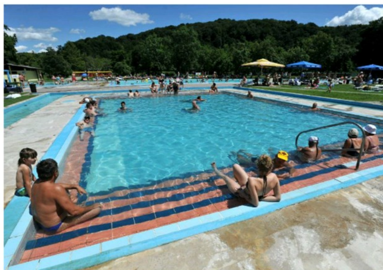
Stubičke Toplice

Termalna voda Stubičkih Toplica ima izrazito visoku temperaturu koja varira od 46 do 63 stupnjeva Celzija, a što samo dokazuje da dolazi iz velikih dubina. Voda je radioaktivna što u kombinaciji s bogatim kemijskim sastojcima daje vodi veliku ljekovitost.