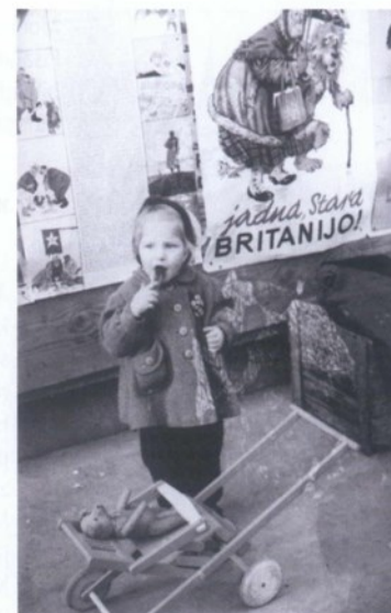
Karlovački korzo, 1945. Kafotka

Povijest treba stalno preispitivati, a posebno one godine, događaje, pojave i osobe koje su već postale neupitne, kanonizirane i čvrsto postavljene vrijednosti. Ne zato da bi ih se postavilo opozitno, već zato da bi se pokazalo što ih je to takvima učinilo.