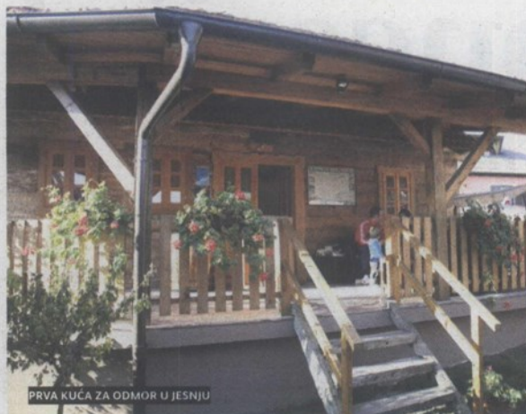
PRVA KUĆA ZA ODMOR U JESENJU

– Taj će primjer sigurno potaknuti i druge da krenu tim