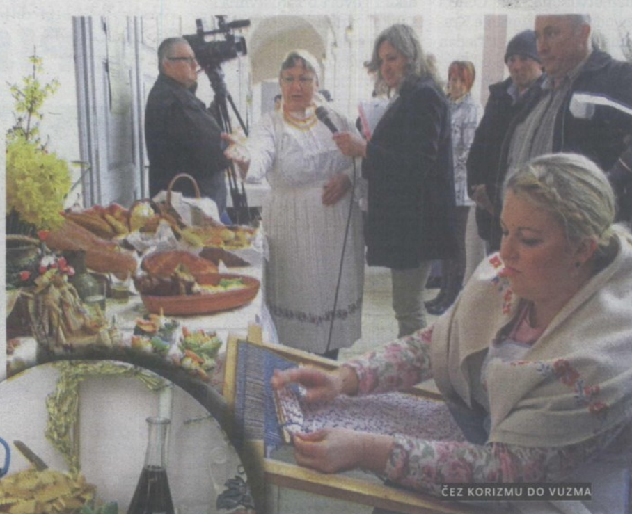
ČEZ KORIZMU DO VUZMA