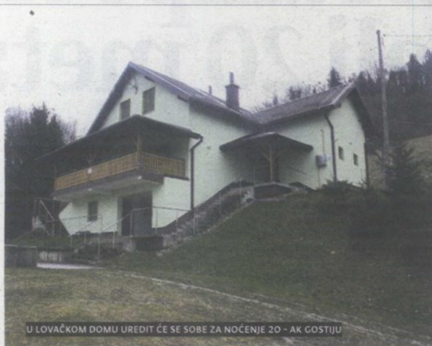
U LOVAČKOM DOMU UREDITI ĆE SE SOBE ZA NOĆENJE 20 - AK GOSTIJU