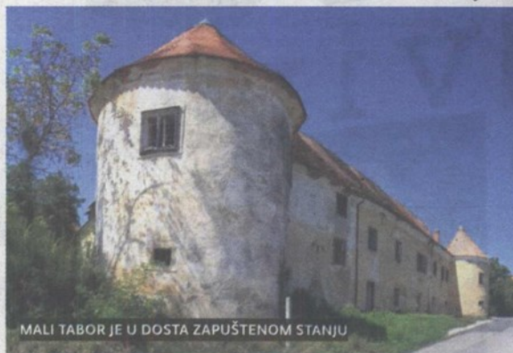
MALI TABOR JE U DOSTA ZAPUŠTENOM STANJU

HUM NA SUTLI - Među brojnim zagorskim dvorcima koji se prodaju je i dvorac Mali Tabor u Humu na Sutli, brat dvorca Veliki Tabor , koji na njega i podsjeća, a za kojeg vlasnici traže 4,1 milijuna kuna. Dvorac tlocrtno površine 1.254 m 2 , na zemljištu površine 50.570 m 2 je ustvari kaštel. Nalazi se uz samu lokalnu cestu. Prodaju ga dva vlasnika, poduzetnika. Jedan je dio polovicu kupio od Poljoprivredne zadruge, a drugi naslijedio po obiteljskoj liniji. Iako je stariji, kaštel Mali Tabor spominje se prvi put u pisanim izvorima na kraju 15. stoljeća. U fasciklima arhiva obitelji Rattkaj nema podataka koji bi sa sigurnošću ukazivali na vrijeme i njegove gra-