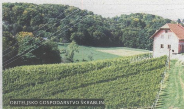
OBITELJSKO GOSPODARSTVO ŠKRABLIN

pularno nazvana 'zagorski slatkiš'. Ukoliko se pak odlučite za gastronomske užita-