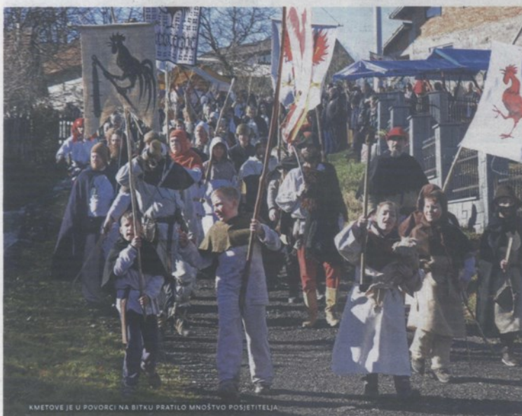
KMETOVE JE U POVORCI NA BITKU PRATILO MNOSTVO POSJETITELJA