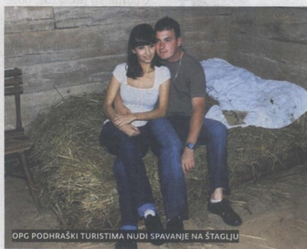
OPG PODHRAŠKI TURISTIMA NUDI SPAVANJE NA ŠTAGLJU