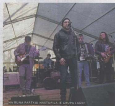
NA BUNA PARTYJU NASTUPILA JE GRUPE LACEF