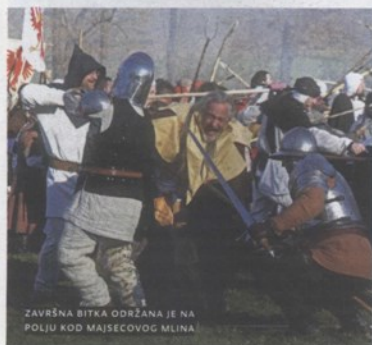
ZAVRŠNA BITKA ODRŽANA JE NA POLJU KOD MAJSECOVOG MLINA