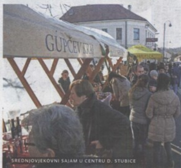
SREDNJOVJEKOVNI SAJAM U CENTRU D. STUBICE