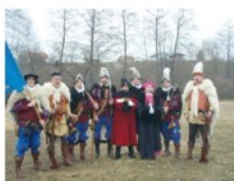
Koprivnički mušketiri i haramije na Seljačkoj buni