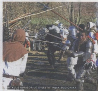
BITKU JE UPRIZORILO DVIJESTOTINJAK SUDIONIKA