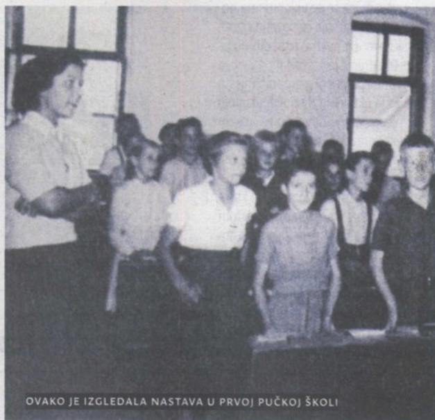
OVAKO JE IZGLEDALA NASTAVA U PRVOJ PUČKOJ ŠKOLI