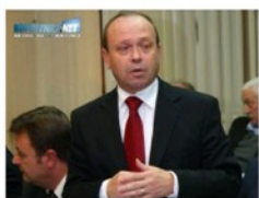
Pal: "Seljačke bune dizao je nezadovoljan narod"