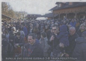
BUNU JE OVE GODINE GLEDALO 7-8 TISUĆA POSJETITELJA