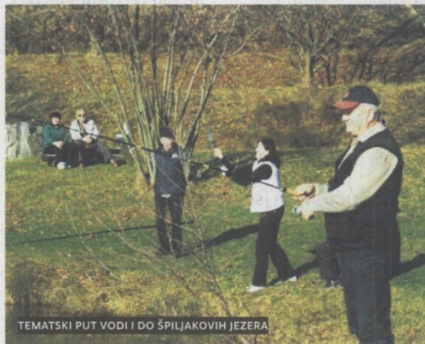
TEMATSKI PUT VODI I DO ŠPILJAKOVIH JEZERA