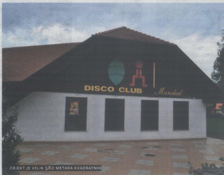
OBJEKT JE VELIK 580 METARA KVADRATNIH