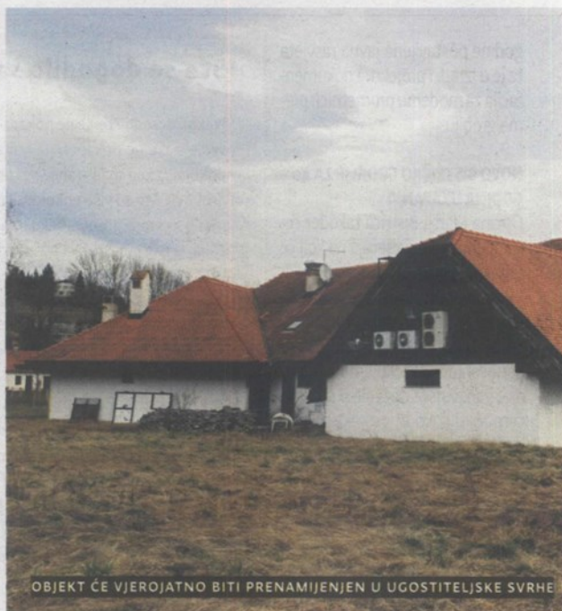
OBJEKT ĆE VJEROJATNO BITI PRENAMIJENJEN U UGOSTITELJSKE SVRHE