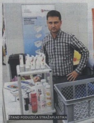
ŠTAND PODUZEĆA STRAŽAPLASTIKA