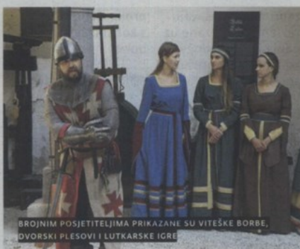
BROJNIM POSJETITELJIMA PRIKAZANE SU VITEŠKE BORBE, DVORSKI PLESOWI I LUTKARSKE IGRE

cijama diljem Hrvatske. Uz oživiljavanje slavnog doba srednjovjekovnog viteštva i legendarnog doba nesretne Veronike Desiničke, brojnim posjetiteljima su prikazane viteške borbe, dvorski plesovi, lutkarske predstave i muzejske radionice. Slijedeće subote (19. rujna) ova priredba će se ponoviti za one koji uglavnom zbog berbe gožda nisu mogli doći na prvu predstavu, a posljednja će se održati u subotu 26. rujna, također od 14 do 18 sati. (Ivo Šučur)