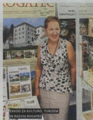
ZAVOD ZA KULTURU, TURIZEM I RAZVOJ ROGATEC