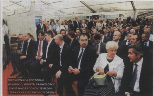
PREDSEDNIK VLADE ZORAN MILANOVIĆ, MINISTRI BRANKO GRČIĆ I SINIŠA HAJDAŠ DONČIĆ TE BROJNI UZVANICI NA SVEČANOM OTVORENJU

Tradicionalno sudjelujemo na zboru, to je dio naše socijalne odgovornosti. Svaki puta izložimo nešto novo, sada je novost da smo postali dio Wienerberger grupacije, u okviru čega očekujemo jačanje tržišne pozicije u Hrvatskoj i inozemstvu. Ostvarujemo planске ciljeve i s optimizmom gledamo u budućnost - kaže direktor prodaje Mladen Kostjil.