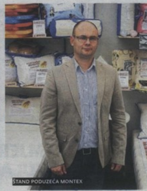
ŠTAND PODUZEĆA MONTEX