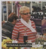
OPG KATARINA AUGUSTIN HUM NA SUTLI

ste imali ovdje prije dosta godina, a to je proizvodnja, kreacija, težnja za stalnim usavršavanjem i napretkom, to je sraz i natjecanje s najboljima, a to je zapadna Europa. Zagorje i sjeverna Hrvatska idu naprijed, Dalmacija, obala i otoci zbog dobrih ulaganja u kvalitetniju uslugu zarađuju ove godine više nego ikada. Dragi prijatelji, Zagorke i Zagorci, želim vam puno dobra, radite, fokusirajte se na uspjeh - poručio je premijer Milanović, nakon čega je u pratnji potpredsjednika Vlade Branka Grčića, ministra pomorstva, prometa i infrastrukture Siniša Hajdaš Dončića, zamjenika ministra poduzetništva Dražena Prosa i drugih uzvanika razgled