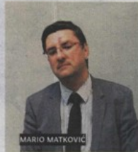
VETROPACK STRAŽA HUM NA SUTLI