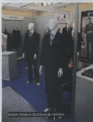
SVOJA ODJELA IZLOŽILA JE I KOTKA