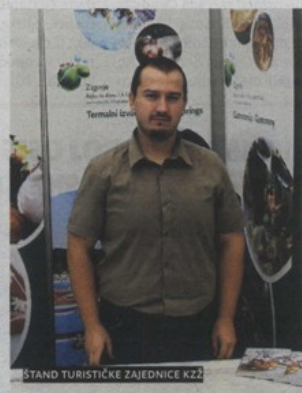
ŠTAND TURISTIČKE ZAJEDNICE KZZ