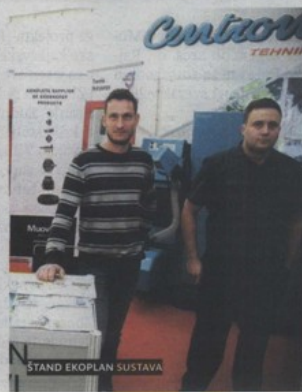
ŠTAND EKOPLAN SUSTAVA