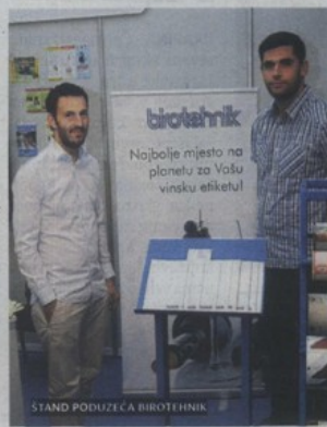
ŠTAND PODUZEĆA BIOTEHNIK