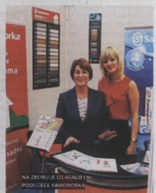
NA ZBORU JE IZLAGALO I PODUZEĆE SAMOBORKA