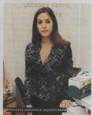
PODUZEĆE DUNAPACK VALOVITI PAPIR