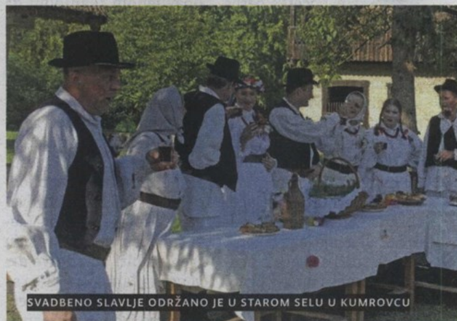
SVADBENO SLAVLJE ODRŽANO JE U STAROM SELU U KUMROVCU