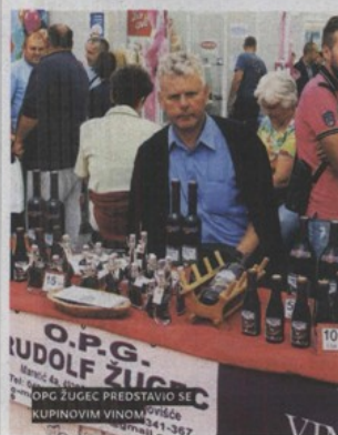
O.P.G. ZÜGELC PREDSTAVIO SE NA ZBORU