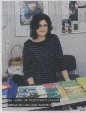
NA ZBORU SE PREDSTAVIO I RADIO HRVATSKO ZAGORJE KRAPINA