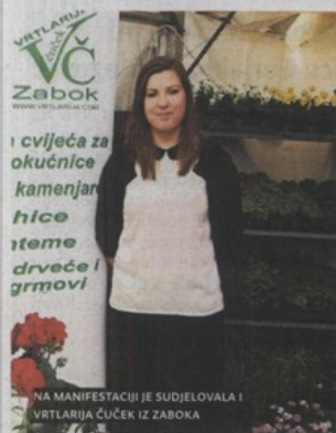
NA MANIFESTACIJI JE SUDJELOVALA I VRTLARIJA ČUČEK IZ ZABOKA