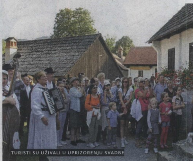
TURISTI SU UŽIVALI U UPRIZORENJU SVADBE

Posjetitelji Muzeja "Staro selo", u popratnom programu nazočili su prikazu tradicijskog obrta