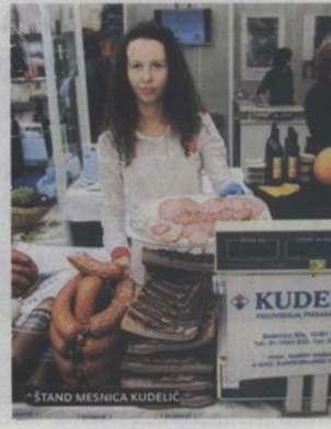
ŠTAND MESNICA KUDELIC