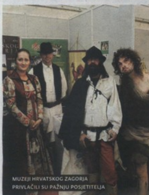
MUZEJI HRVATSKOG ZAGORJA PRIVLAČILI SU PAŽNJU POSJETITELJA