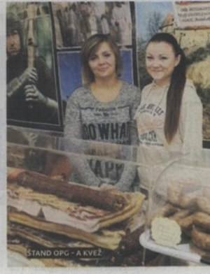
ŠTAND OPG - A KVEZ