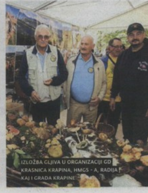
IZLOŽBA GLJIVA U ORGANIZACIJI GO KRASNICA KRAPINA, HMGS - A, RADIJA KAJ I GRADA KRAPINE

Press CLIPPING d.o.o., tel.: +385 (0)1 / 3094804, e-mail: press@pressclip.hr, www.pressclip.hr Korisnik usluga ne smije dalje reproducirati i / ili distribuirati dostavljene mu Programske sadržaje medija bez posebnog odobrenja Nositelja prava (DZNPAP i HDS-ZAMP)