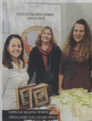
UDRUGA MLADIH FENIKS OROSLAVJE I LAG ZELENI BREG