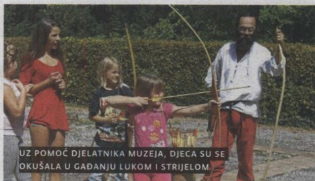
UZ POMOĆ DJELATNIKA MUZEJA, DJECA SU SE OKUŠALA U GAĐANJU LUKOM I STRIJELOM.

GORNJA STUBICA – Muzej seljačkih buna prošlog je tjedna organizirao muzejsko – edukativne radionice za djecu željnu otkrivanja arheologije i povijesti pod nazivom "Muzej prije škole". Desetak djece, uglavnom s lokalnog područja, ali i mališani iz Zagreba koji su još koristili praznike kod svojih baka i djedova u stubičkom kraju, sudjelovali su u raznoraznim programima koje su za njih osmislili kustosice i preparator muzeja u Gornjoj Stubici. Tijekom tri sata druženja, od ponedjeljka do petka, djeca su mogla naučiti barataći lukom i strijelom ili loviti plijen u okruženju dvorca, izraditi zmaja na lutkarskoj radionici ili pak osmisliti i izraditi vlastiti grb te