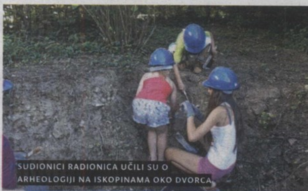
SUDIONICI RADIONICA UČILI SU O ARHEOLOGJI NA ISKOPINAMA OKO DVORCA.