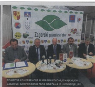
TISKOVNA KONFERENCIJA U KRAPINI KOJOM JE NAJAVLJEN ZAGORSKI GOSPODARSKI ZBOR ODRŽANA JE U PONEDELJAK

NA PROSTORIMA OŠ LJUDEVIT GAJ KRAPINA, NA 1.200 m 2 ZATVORENOG I 1.500 m 2 OTVORENOG SAJAMSKOG PROSTORA, BITI ĆE SMJEŠTENO 250 IZLAGAČA