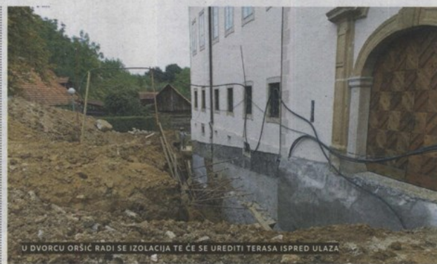
U DVORCU ORŠIĆ RADI SE IZOLACIJA TE ĆE SE UREDITI TERASA ISPRED ULAZA