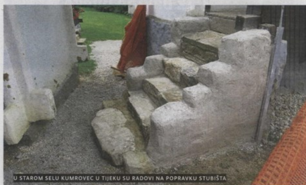
U STAROM SELU KUMROVEC U TIJEKU SU RADovi NA POPRAVKU STUBIŠTA