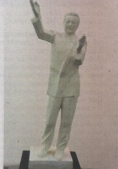
Jedan od radova s izložbe