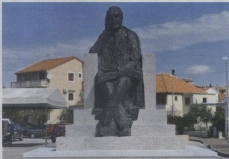
Tudman u Pakoštanima

– Velika doza diletantizma, nevjerojatne likovne nepismenosti i neodgovornosti prema jav-