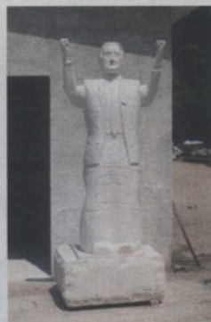
Tudman u suknji