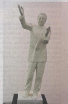
Jedan od radova s izložbe