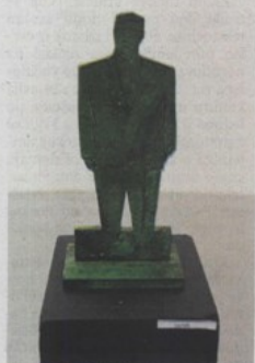
Ironija? – prijedlog Ivana Fiolčića