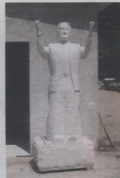
Tudman u suknji