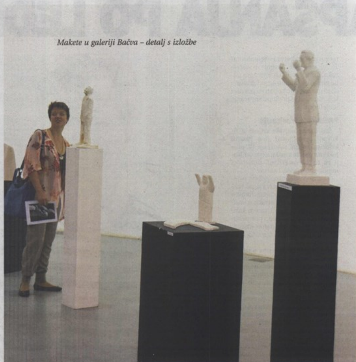
Makete u galeriji Bačva – detalj s izložbe

O d osamdesetak spomenika Franji Tuđmanu, posijanih širom Hrvatske (u rasponu od bista do gigantskih skulptura u natprirodnoj veličini), teško je pronaći neki koji dostojanstveno tretira prvog predsjednika. S većinom se desilo ono najgora: rađeni su s nakanom da budu smrtno ozbiljni, a ispali su blesavi i smiješni