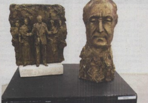
Prijedlog Zlatna Čulara