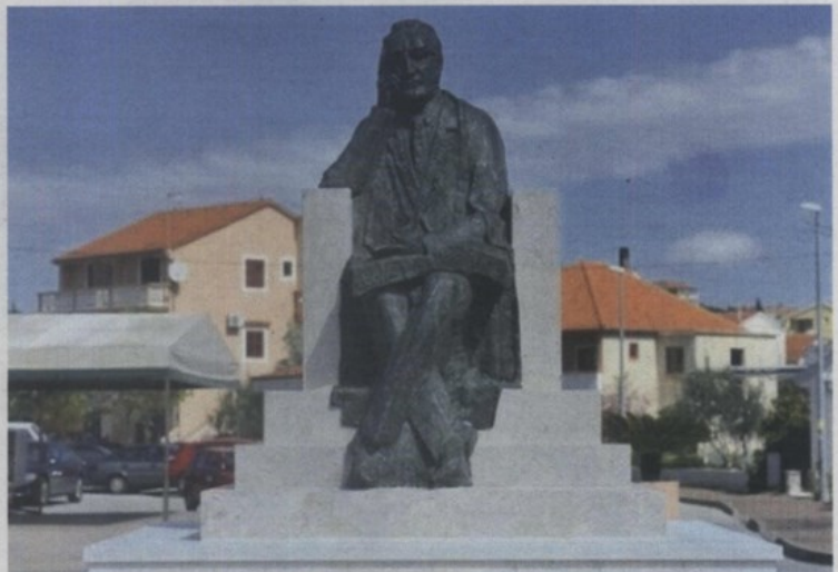
Tudman u Pakoštanima

– Velika doza diletantizma, nevjerojatne likovne nepismenosti i neodgovornosti prema jav-