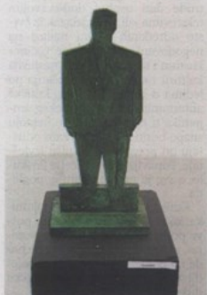
Ironija? – prijedlog Ivana Fiolija