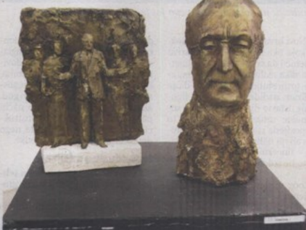
Prijedlog Zlatna Čulara