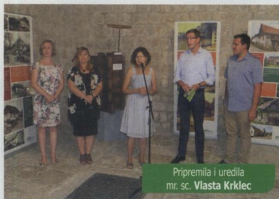
Pripremila i uredila mr. sc. Vlasta Krklec

Dodite, učite i dobro se zabavite! - pozivaju iz Muzeja krapinskih neandertalaca .