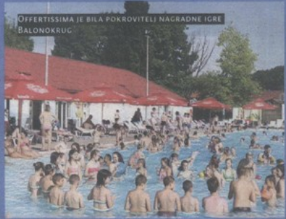
OFFERTISSIMA JE BILA POKROVITELJ NAGRADNE IGRE BALONOKRUG