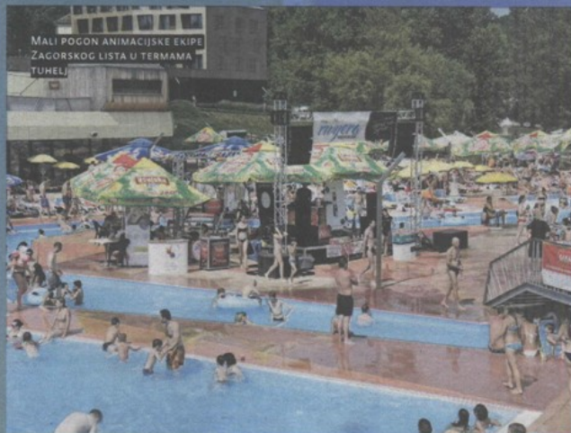
MALI POGON ANIMACIJSKE EKIPJE ZAGORSKOG LISTA U TERMAMA TUHELJ