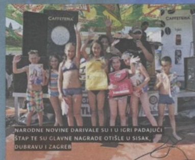
NARODNE NOVINE DARIVALA SU I U IGRI PADAJUĆI STAP TE SU GLAVNE NAGRADE OTIŠLE U SISAK, DUBRAVU I ZAGREB