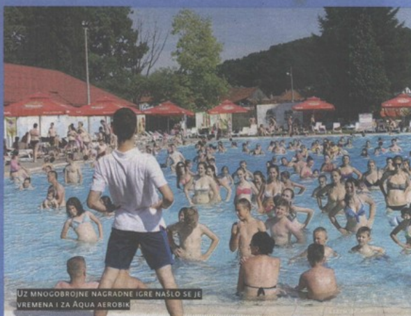
UZ MNOGOBROJNE NAGRADNE IGRE NASLO SE JE VREMENA I ZA AQUA AEROBIK