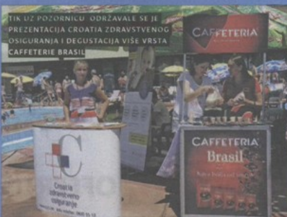
TIK IZ POZORNICU ODRŽAVALE SE JE PREZENTACIJA CROATIA ZDRAVSTVENOG OSIGURANJA I DEGUSTACIJA VIŠE VRSTA CAFFETERIE BRASIL

Press CLIPPING d.o.o., tel.: +385 (0)1 / 3094804, e-mail: press@pressclip.hr, www.pressclip.hr Korisnik usluga ne smije dalje reproducirati i / ili distribuirati dostavljene mu Programske sadržaje medija bez posebnog odobrenja Nositelja prava (DZNPAP i HDS-ZAMP)