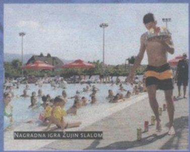
NAGRADNA IGRA ŽUJIN SLALOM