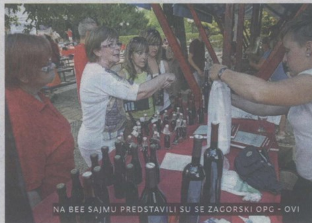
NA BEE SAJMU PREDSTAVILI SU SE ZAGORSKI OPG - OVI

U angažmanu TZP Donja i Gornja Stubica održan je i Bio eko, etno sajam na kojem su se predstavili OPG – ovi, a KUD Matija Gubec organizirao je i gljivarenje i humanitarnu akciju na kojoj su se prodajom kolača, pića i gljivarskih delacija, prikupljala sredstva za gornjostubički Caritas