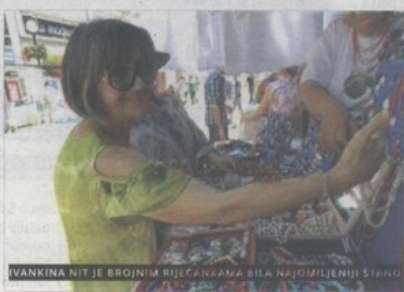
IVANKINA NIT JE BROJNIM RIJEČANKAMA BILA NAJOMILJENIJI STANU