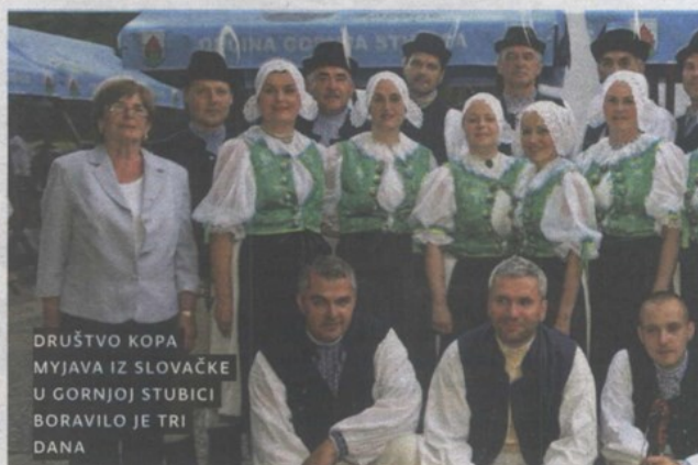
DRUŠTVO KOPA MYJAVA IZ SLOVAČKE U GORNJOJ STUBICI BORAVILO JE TRI DANA