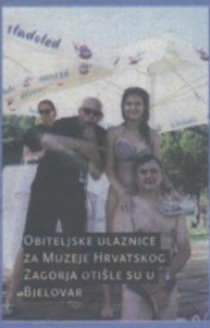
OBITELJSKE ULAZNICE ZA MUZEJE HRVATSKOG ŽAGORJA OTIŠLE SU U BIJELOVAR