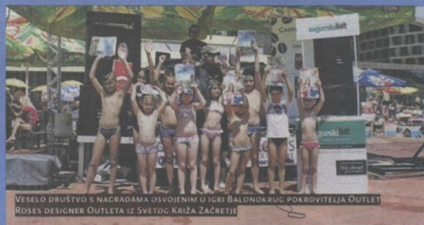
VESELO DRUŠTVO S NAGRADAMA OSVOJENIM U IGRI BALONOKRUG POKROVITELJA OUTLET ROSES DESIGNER OUTLETA IZ SVETOG KRIŽA ZAČETIJE