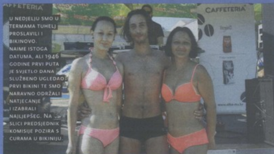
U NEDJELJU SMO U TERMAMA TUHELJ PROSLAVILI I BIKINOVO. NAJME ISTOGA DATUMA, ALI 1946. GODINE PRVI PUTA JE SVJETLO DANA SLUŽBENO ULEĐANJE PRVI BIKINI TE SMO NARAVNO ODRŽALI NATJECANJE I IZBRALI NAJLJEPŠEG. NA SLICI PREDSEDNIK KOMISIJE POZIRA S ČURAMA U BIKINIJU