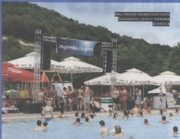
MALI POGON ANIMACIJSKE EKIPE ZAGORSKOG LISTA U TERMAMA JEZERČICA