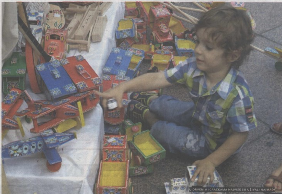
U DRVENIM IGRAČKAMA NAJVIŠE SU UŽIVALI NAJMAĐI

Ipak, sam doživljaj jednoga grada kao što je Rijeka, ciljanog tržišta i cilijane skupine, u potpunosti izlazi iz svakog okvira stručne terminologije, jer cijela se priča svodi na ono najvažnije, na ljudsku dimenziju, na direktno postojevanje destinacije s doživljajem