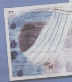
Vida, 10 god.