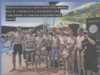
OSIM DEGUSTACIJE KAVE CAFFETERIA BRASIL BILA JE I POKROVITELJ NAGRADNE IGRE S BALONIMA TE DARIVALA NAJSPRETNIJE IGRAČE