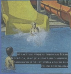
ATRAKTIVNI VODENI TOBOČAN TERMAMA JEZERČICA, IAKO JE KUPAČA BILO MNOGO, OMOGUĆIO JE SPUST SVIMA KOJI SU BILI ŽELJNI ADRENALINA