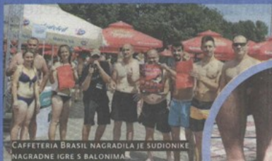
CAFFETERIA BRASIL NAGRADILA JE SUDIJKINE NAGRADNE IGRE S BALONIMA