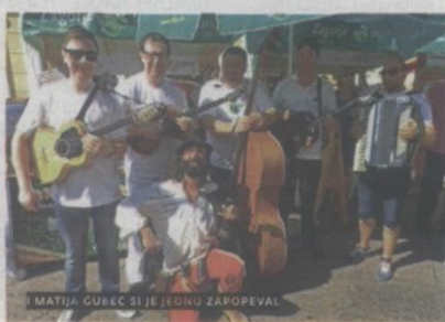
MATIJA GUBEC SI JE JEDNU ZAPOPEVAL