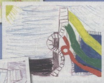
Tara Ivčinec, 10 god.