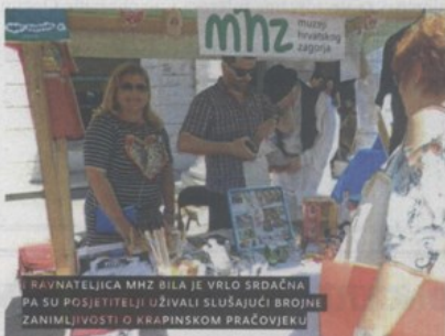
RAVNATELJICA MHZ BILA JE VRLO SRDAČNA PA SU POSJETITELJI UŽIVALI SLUŠAJUĆI BROJNE ZANIMLJIVOSTI O KRAPINSKOM PRAČOVJEKU