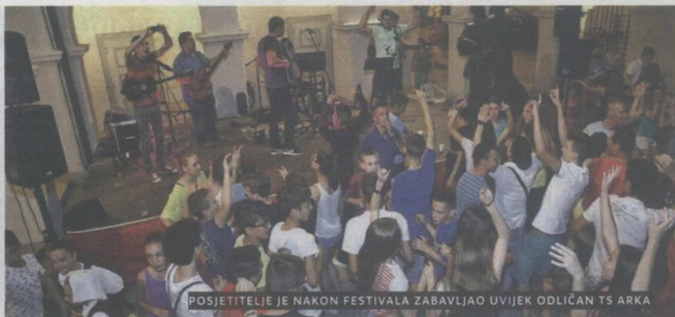
POSJETITELJE JE NAKON FESTIVALA ZABAVLJAO UVIJEK ODLIČAN TS ARKA