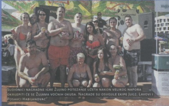
SUDIONICI NAGRADNE IGRE ŽUJINO POTEZANJE UZETA NAKON VELIKOG NAPORA OKRIJEPITI CE SE ŽUJAMA VOČNIH OKUSA. NAGRADE SU OSVOJILE EKIPJE JUG2, LAVOVI I POSAVCI HABJANOVAC