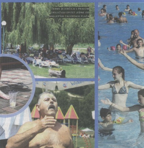
TERME JEZERČICA S PRAVOM ZASLUŽUJU EPITET JEDNE OD NAJLJEPŠIH ZAGORSKIH PLAŽA