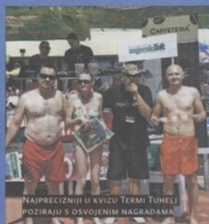
NAJPRECIZNIJI U KVIZU TERMI TUHELJ POZIRAJU S OSVOJENIM NAGRADAMA