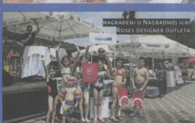
NAGRADENI U NAGRADNOJ IGRI ROSES DESIGNER OUTLETA