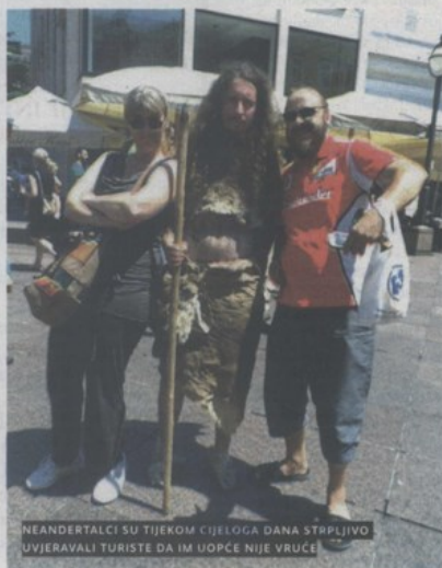
NEANDERTALCI SU TIJEKOM CIJELOGA DANA STRPLJIVO UJVERAVALI TURISTE DA IM UOPĆE NIJE VRUĆE