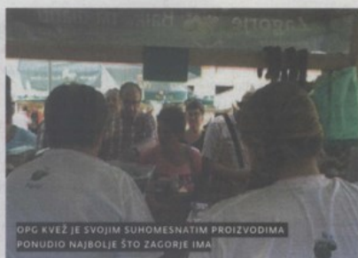
OPG KVEŽ JE SVOJIM SUHOMESNATIM PROIZVODIMA PONUDIO NAJBOLJE ŠTO ZAGORJE IMA