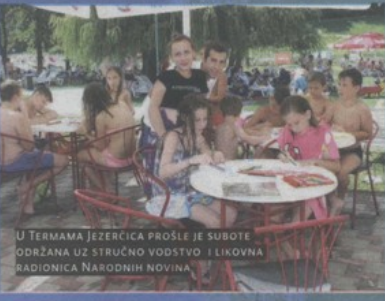
U TERMAMA JEZERČICA PROŠLE JE SUBOTE ODRŽANA UZ STRUČNO VODSTVO I LIKOVNA RADIONICA NARODNIH NOVINA