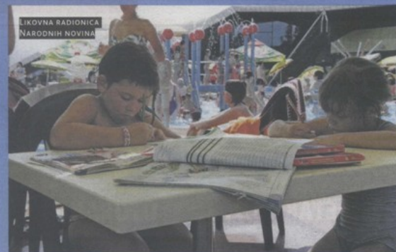
LIKOVNA RADIONICA NARODNIH NOVINA