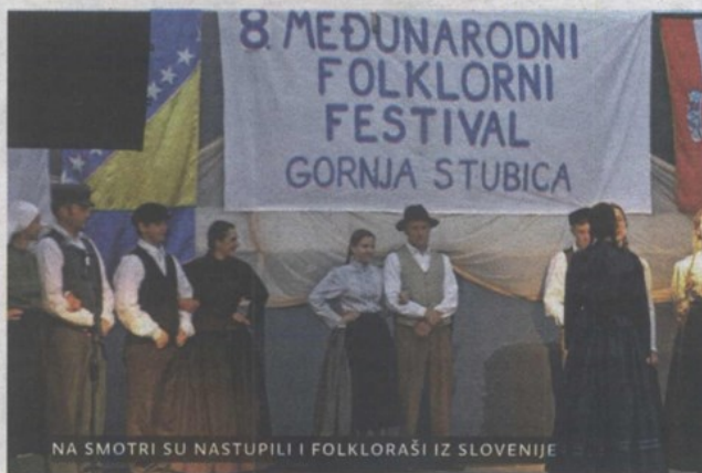
NA SMOTRI SU NASTUPILI I FOLKLORISTI IZ SLOVENIJE