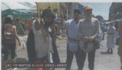
JEL TO MATIJA GUBEC NEKAJ SROIT