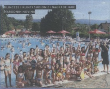
KLINCEZE I KLINCI SUDIONICI NAGRADNE IGRE NARODNIH NOVINA