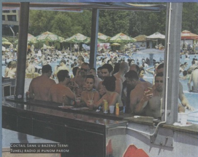
COCTAIL ŠANK U BAZENU TERMI TUHELJ RADIO JE PUNOM PAROM