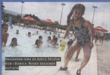
NAGRADNA IGRA ZA DJECU SPUŽVA BOB I BOBICA ROSES DESIGNER OUTLETA