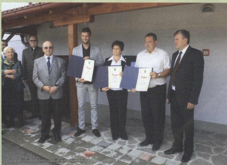
Ovogodišnji dobitnici općinskih priznanja

Obiteljski obrt Politeks bavi se proizvodnjom kolutova za poliranje, konopa, užadi i ostalog industrijskog i tehničkog tekstila. Osnovan 1978. uspješno se nosi sa poslovnim izazovima gotovo 40 godina.