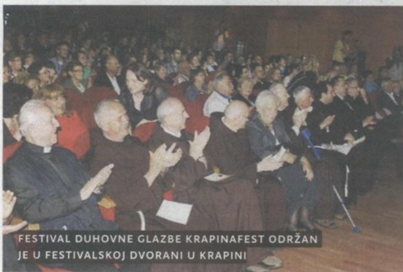
FESTIVAL DUHOVNE GLAZBE KRAPINAFEST ODRŽAN JE U FESTIVALSKOJ DVORANI U KRAPINI