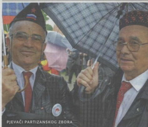
PJEVAČI PARTIZANSKOG ZBORA