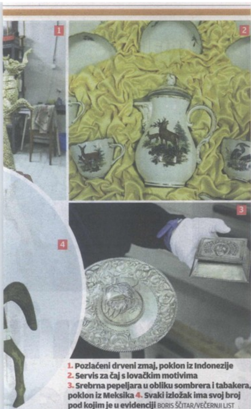
1. Pozlaćeni drveni zmaj, poklon iz Indonezije 2. Servis za čaj s lovačkim motivima 3. Srebrna pepeljara u obliku sombrera i tabakera, poklon iz Meksika 4. Svaki izložak ima svoj broj pod kojim je u evidenciji