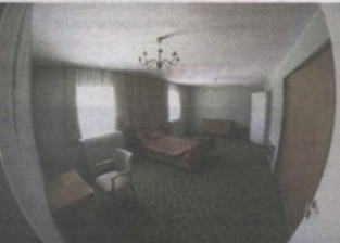
Preslik fotografije iz albuma Titova posjeta Finskoj (gore), Titova spavaonica (u sredini), maketa svemirske postaje Apollo, NASA-in dar (dolje) BORIS ŠČITAR