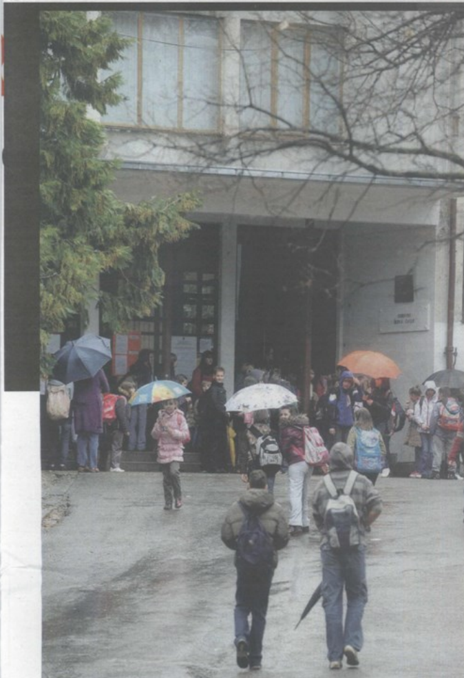
Učenici OŠ Čavle i prethodnih su godina išli na izlet s antifašistima