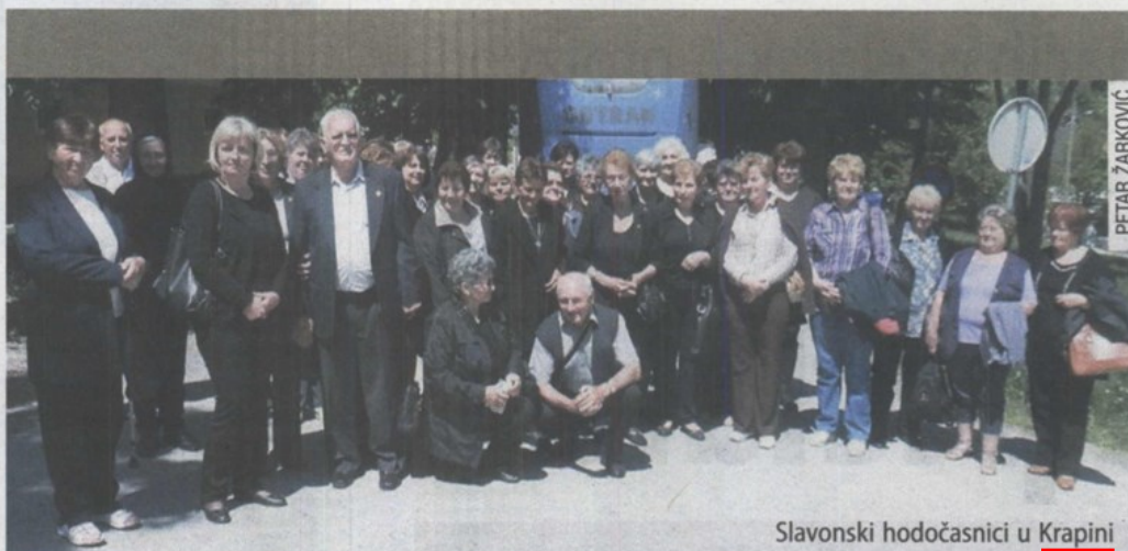
Slavonski hodočasnici u Krapini