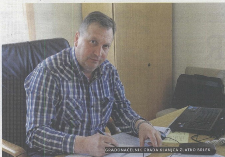
GRADONAČELNIK GRADA KLANJCA ZLATKO BRLEK

ZLATKO BRLEK: Mislim da na koncu možemo biti zadovoljni. Završili smo prošlu godinu s otprilike 4% više proračunskih prihoda te smo vrlo pažljivim raspolaganjem proračunskim novcem i štednjom gdje god je to bilo moguće ostvarili i višak prihoda od 400.000 kuna. Prošlo ćemo razdoblje sigurno zapamtiti po uspješnom apliciranju za sredstva Europske unije.