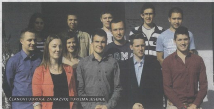
ČLANOVI UDRUGE ZA RAZVOJ TURIZMA JESENJE

Tragovima neandertalaca Iako ne djeluju dugo, 15 mladih članova dosad je osmislilo hvalevrijedan projekt "Staze krapinskih neandertalaca" koji se pokazao veoma zanimljivim i obećavajućim. Za njega su dobili brojne nagrade i priznanja, od kojih se osobito izdvaja CBTour, prestižna nagrada u kategoriji za najbolju tehnologiju u hrvatskom poslovnom turizmu i brončano odličje na sajmu inovacija Inova – "Budi uzor" 2013. - Projekt je zamišljen s idejom da se proširi ponuda Muzeja krapinskih neandertalaca u Krapini. Poznato je da je krapinski neandertalac bio nomad te da se u potrazi za hranom, skloništem i drugim potrebštinama morao snalaziti i u široj okolici svojeg glavnog obitavališta. Za sklonište su mu služile špilje te ostali prirodni zakloni u bližoj i široj okolici Hušnjakova, a šire područje općine Jesenje obiluje špiljama za koje postoje čvrste indicije da ih je koristio