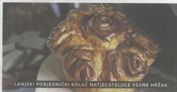
LANJSKI POBJEDNIČKI KOLAČ NATJECATELJICE VESNE HRŠAK

Profila, a prije toga, izložene kolače moći će kušati i svi posjetitelji u Petrovskom kamo je manifestaciju ove godine dovela lanjska pobjednica Vesna Hršak. Organizatori manifestacije su Krapinsko – zagorska županija i Turistička zajednica KZŽ. (zl)