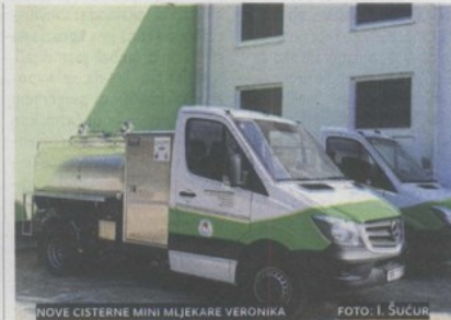
NOVE CISTERNE MINI MLJEKARE VERONIKA

pripremi i provedbi poduzetničkih projekata koji su rezultirali investicijskim ciklusom preko 329 milijuna kuna. U sektoru ruralnog razvoja i turizma, Agencija je potpora u pripremi projekata za vinare, poljoprivrednike, ugostitelje, a direktni rezultat je 1,2 milijuna kuna projekata koji su ostvarili potporu kroz Nacionalni program pomoći sektoru vina. Aktivnosti vezane za realizaciju sredstava dostupnih iz Europskih fondova odnose se na provedbu projekata koji su ostvarili potporu. Tako je tijekom 2014. i u prvom kvartalu 2015. godine započela provedba ukupno 8 projekata u čijoj je prijavi sudjelovala Agencija, a i sada sudjeluje u provedbi. Od navedenih 8 projekata, 3 se projekta odnose na prekograničnu suradnju (vrijednost 700.000,00 EUR) – Upoznajmo i uživajmo, Igraj se!, Ride & Bike. Projekt Partnerstva & Mogućnosti koji se financira iz Europskog socijalnog fonda vrijedan je 30.000,00 EUR te