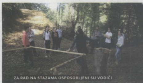
ZA RAD NA STAZAMA OSPOSOBLJENI SU VODIČI

Na stazama krapinskih neandertalaca mogu se vidjeti demonstracije preživljavanja krapinskog čovjeka kao što su paljenje vatre, obrada oruđa, izrada odjeće i koplja