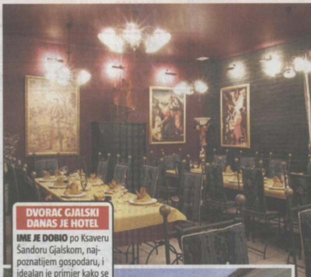
DVORAC GJALSKI DANAS JE HOTEL

- JNA je dvorac 1991. granatirao i godinama poslije propadao je. No kad sam ga kupio, obnovio sam ga uz pomoć pojedinih ministarstava, fondova i drugih