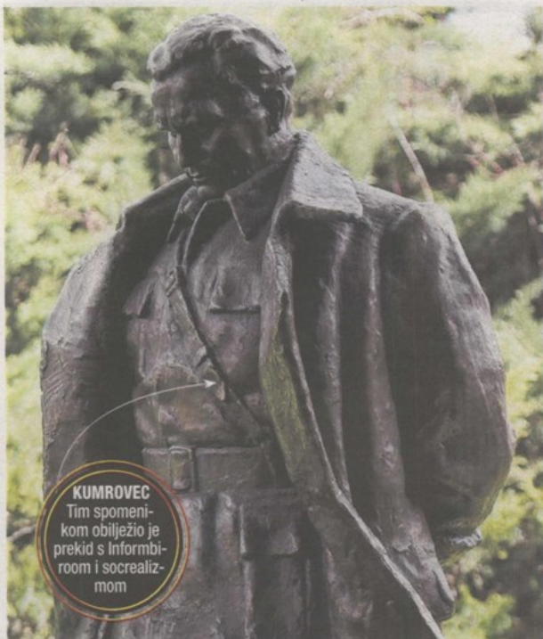
KUMROVEC Tim spomenikom obilježio je prekid s Informativom i socrealizmom