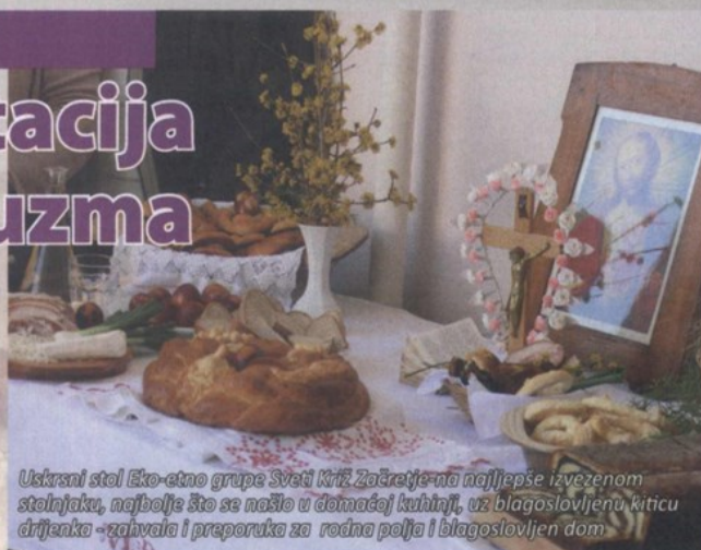
Uskrсни stol Eko-etno grupe Sveti Križ Začretje na najljepše izvezenom stolnjaku, najbolje što se našlo u domaćoj kuhinji, uz blagoslovljenu kiticu drijenka - zahvala i preporuka za rodno polje i blagoslovljen dom

U organizaciji Udruge Lipin cviet 21. ožujka u Muzeju seljačkih buna u Gornjoj Stubici, održana druga korizmeno-uskrсна manifestacija Čez korizmu do Vuzma, kojom se posjetiteljima želi pokazati kakvi su nekada bili običaji za vrijeme korizme i Uskrsa.