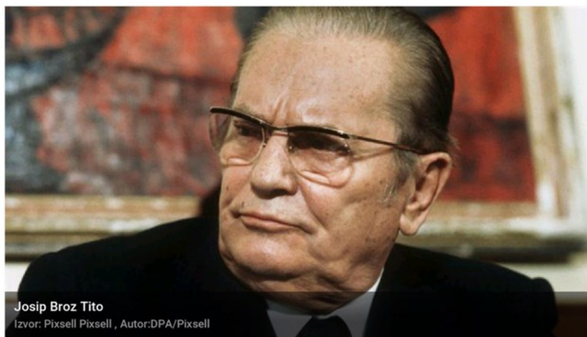
Josip Broz Tito