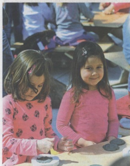
Najmlađi su uživali u izradi glinenih novčića

KAD SE MALE RUKU SLOŽE NA RIVI ODRŽANE ZANIMLJIVE RADIONICE U SKLOPU 8. SKUPA MUZEJSKIH PEDAGOGA