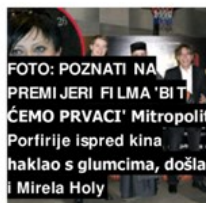
FOTO: POZNATI NA PREMIJERU FILMA 'BIT ČEMO PRVACI' Mitropolit Porfirije ispred kina haklao s glumcima, došla i Mirela Holy

TAKO JE GLOGOŠKI GOVORIO PRIJE 20 GODINA 'Komunisti su bili prave navikine u odnosu na HDZ, za ovo se nije isplatilo boriti!'