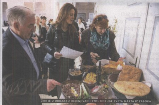
ZIRIJE U OBILASKU OCJENJIVAO I STOL UDRUGE SVETA MARTA IZ ZABOKA