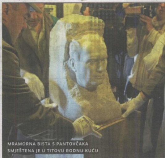
MRAMORNA BISTA S PANTOVČAKA SMJEŠTENA JE U TITOVU RODNU KUĆU

S PANTOVČAKA U STARO SELO Proteklog je četvrtka bista Josipa Broza Tita bila na Pantovčaku, vraćena u Kumrovec . Osim mramorne biste, vraćeni su stotinjak predmeta koje su Tito i Jovanka dobivali sa svih strana svijeta