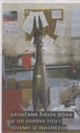
BRONČANA ŽIRAFA JEDAN JE OD DAROVA TITU I JOVANKI IZ INDOZEZIJE

Prema riječima kustosa Galerije Antuna Augustinčića , Davorina Vujčića, bista je teška oko 100 kilograma, a nastala je davne 1961. godine na Brijunima kao glineni portret