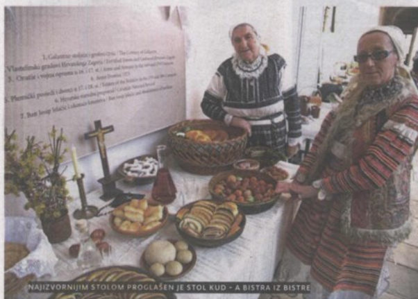
NAJIZVORNIJIM STOLOM PROGLAŠEN JE STOL KUD – A BISTRA IZ BISTRE

T ek drugo izdanje manifestacije Čez korizmu do Vuzma, koja je lani po prvi puta održana u Gornjoj Stubici, prošle je subote okupila zavidan broj sudionika, ali i posjetitelja. Otvorena je izložba Naša stubička baština kroz koju su predstavljene ručni radovi vrijednih Stubičanki, priređen je kulturno - umjetnički program, a oni željni novih znanja mogli su sudjelovati u radionicama izrade košara i pisanica. Udruge i domaćice koje su se prijavile, u hodniku Muzeja seljačkih kuća postavile su svoje uskršnje stolove koje su ocjenjivali pred-