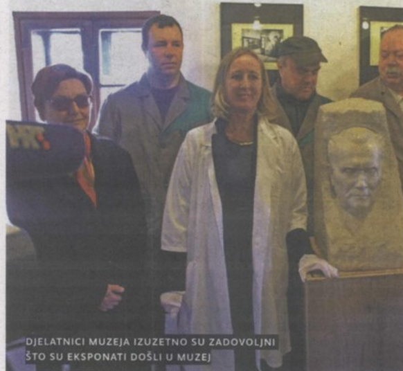
DJELATNICI MUZEJA IZUZETNO SU ZADOVOLJNI ŠTO SU EKSPONATI DOŠLI U MUZEJ

poklonjeni predmeti. - Jedan je ugovor kojim se Muzejima daju predmeti na trajno korištenje. Riječ je o mramornoj bisti koja je rad Antuna Augustinčića i čitavoj fotografskoj dokumentaciji o njenom nastajanju, gipasana bista nepoznatog autora, dva ulja na platnu na kojima je Tito prikazan u maršalskoj odori i u civilu te pribor za pušenje od tučenog bakra s pepeljarama i baticima za gašenje cigara. Drugi ugovor je o donaciji, a riječ je o poklonima koje su Tito i Jovanka dobivali sa svih krajeva svijeta - rekla nam je ravnateljica Muzeja Hrvatskog zagorja , Vlasta Krklec .