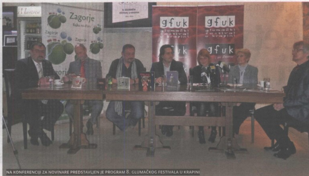
NA KONFERENCIJI ZA NOVINARE PREDSTAVLJEN JE PROGRAM 8. GLUMAČKOG FESTIVALA U KRAPINI