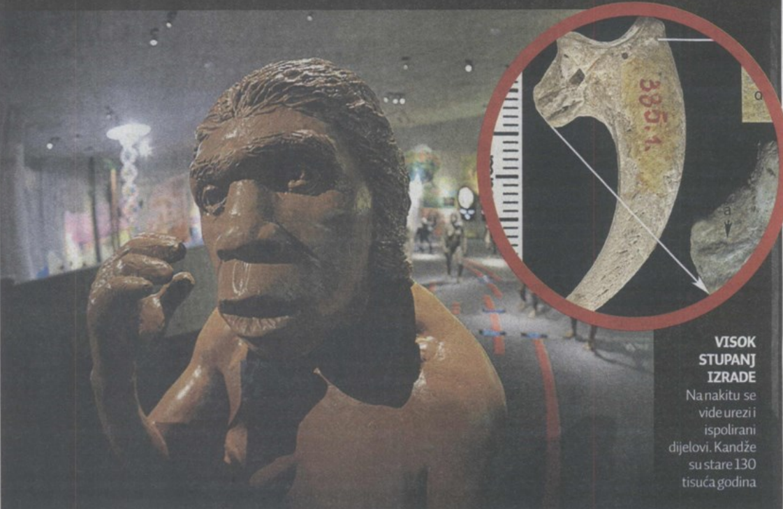
VISOK STUPANJ IZRADE Nanakit se vide urezi i ispolirani dijelovi. Kandže su stare 130 tisuća godina

Da ulovi orla, od čijih se kostiju radio nakit, trebao je viši stupanj razvoja. Neandertalac je to, sada znamo, mogao