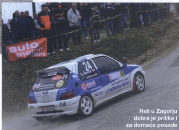
Reli u Zagorju dobra je prilika i za domaće posade