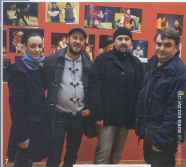
GRADSKI MUZEJ, VIROVITICA