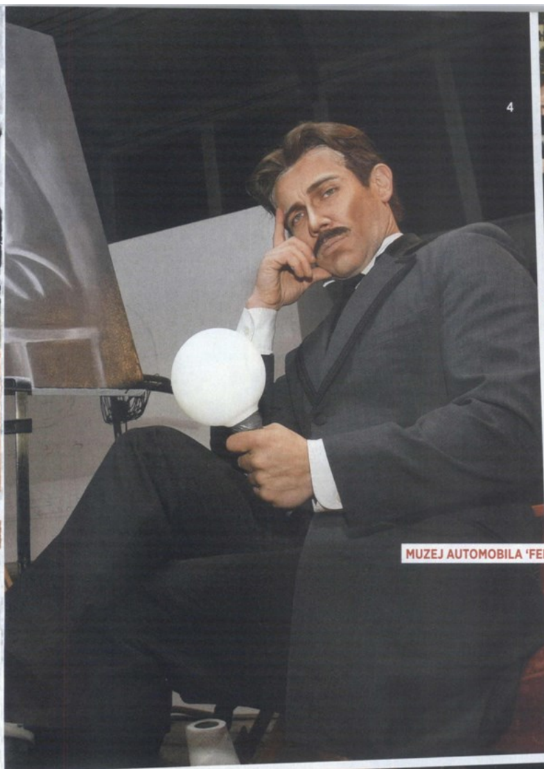
MUZEJ AUTOMOBILA 'FERDINAND BUDICKI', ZAGREB