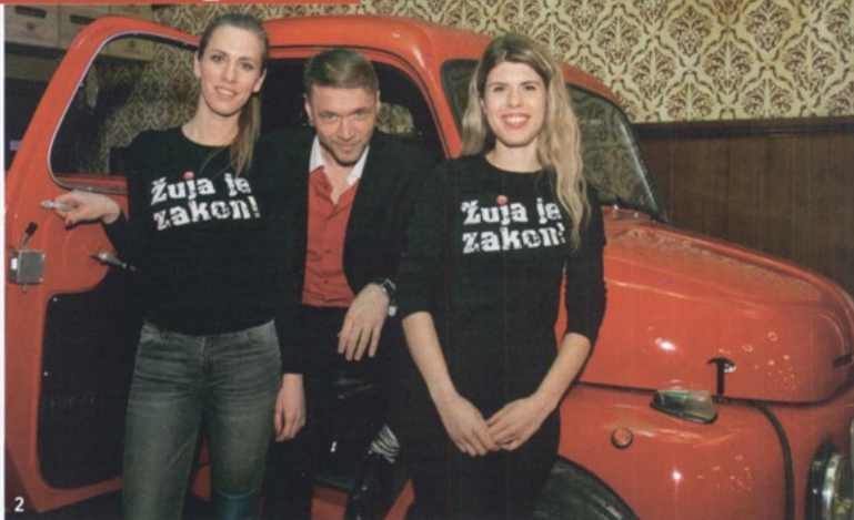
MUZEJ MIMARA, ZAGREB