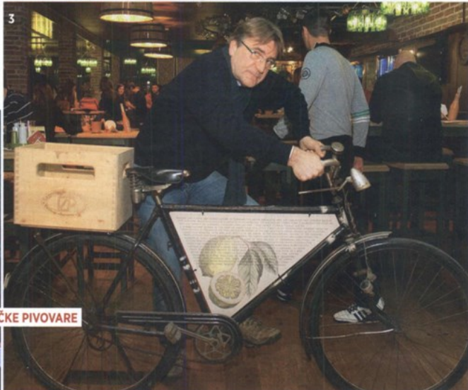
MUZEJ ZAGREBAČKE PIVOVARA