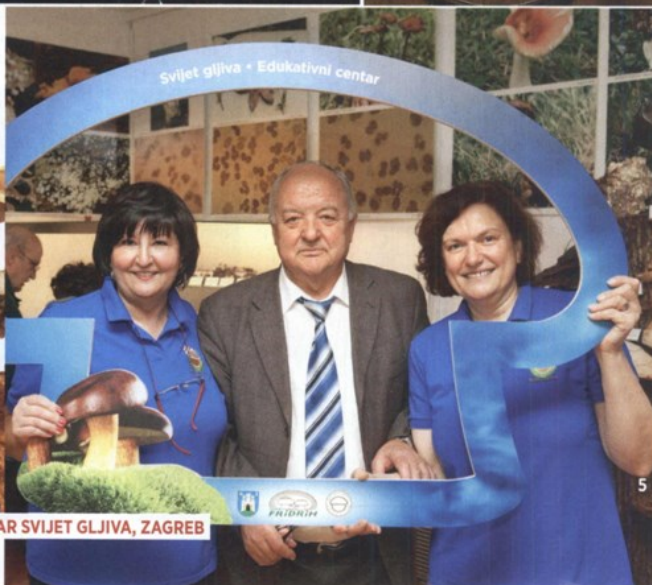
CENTAR SVIJET GLJIVA, ZAGREB