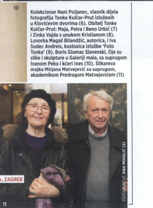
GALERIJA KLOVIĆEVI DVORI, ZAGREB