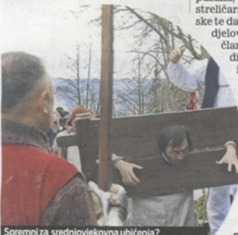
Spremni za srednjovjekovna uhićenja?