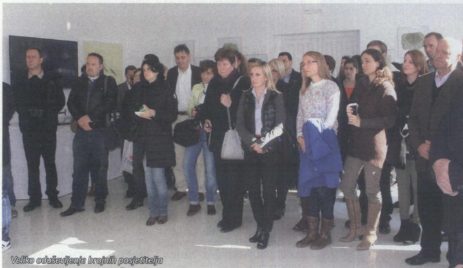
Veliko oduševljenje brojnih posjetitelja

Smatram da Radoboj ima izuzetnu perspektivu kvalitetnog razvoja, ali i mogućnosti otvaranja novih radnih mjesta. Po uzoru na mnoga mala mjesta u europskim zemljama, kultura i turizam su naši pravi aduti, samo ih trebamo iskoristiti na najbolji mogući način.