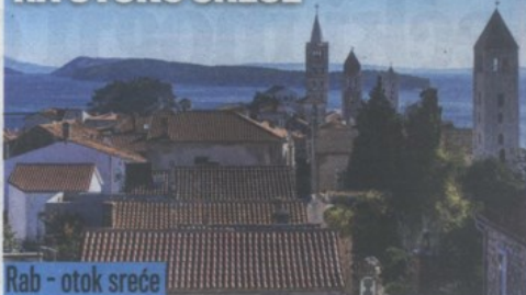
Rab - otok sreće

Stari Rimljani su Rab zvali sretnim otokom, Felix Arba. Sa svojom bogatom povijesti i beskrajnom prirodnom raznolikošću od najfinijeg pijeska preko kamenog krša do uvijek zelenih šuma hrasta crnike, otok Rab u potpunosti zaslužuje taj laskavi naziv.