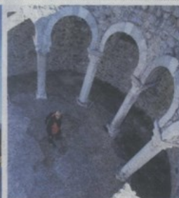
Četiri zvonika simbol su grada Raba (krajnje lijevo). Alpski krajolik pašnjaka na platu Fruga (lijevo u sredini). Ostaci crkve sv. Ivana rijedak su primjer osebujnog oblikovanja tlocrta (gore lijevo). Rapsku tortu domaćice spravlja još od 1177. godine. (gore desno) Rajska plaža u Loparu s pogledom prema najvišem rapskom vrhu (dolje)

ni za ručnik, sada, u jesen, potpuno smo sami. Iznad plaže pronalazimo jednu od dvije otočke planinarske staze koje je izgradio inženjer Ante Premužić, poznatiji po jedinstvenoj Premužićevoj stazi na Velebitu. Vrsno trasiranom stazom penjemo se prema platu Fruga. Goli krš i kamenjar izloženih obronaka ovdje su zamijenili pašnjaci i šume začudne ljepote. Na namreškoj površini fruske lokve zrcale se vrhovi Velebita. Žurimo stići do najvišeg otočkog vrha, Kamenjaka, prije zalaska sunca. S 410 metara nad morem uživamo u divnim vidicima, sretni na Otoku sreće.