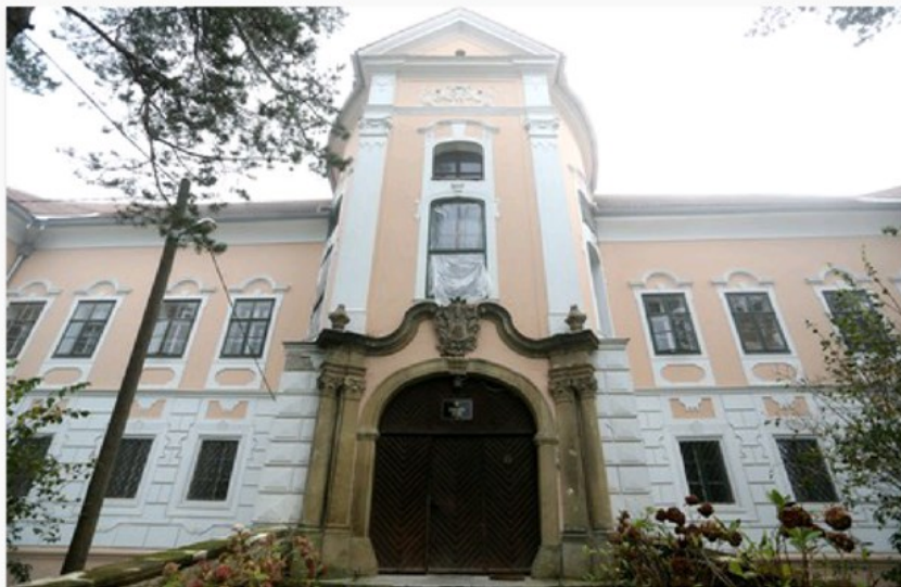
Specijalna bolnica za kronične dječje bolesti u Gornjoj Bistri