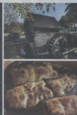
Veliki Tabor je jedan od najupečatljivijih hrvatskih dvoraca (krajnje lijevo). Pogled kroz ruševinu utvrde Cesargrada (lijevo u sredini). Od nekadašnjih mlinova na obroncima Medvednice ostalo ih je sačuvano tek nekoliko (lijevo). Štrukli su vjerojatno najpoznatiji specijalitet zagorske kuhinje (lijevo dolje). Skromna unutrašnjost 'Gupčeve hiže' u Hižakovcu (dolje)

Mihanović spjevao himnu Ljepu Našu, na što podsjeća spomen-obelisk. U blizini je i etno-selo Kumrovec, jedinstven muzej na otvorenom koji dočara izvorni izgled zagorskog sela s početka 20. stoljeća. Cilj našeg puta potpuno je drugačiji. Dvor Veliki Tabor oduševljava svojim monumentalnim zidinama i renesansnom ljepotom utvrđenog grada. Od svih priča koje čuva današnji muzej, najpotresnija je ona o nesretnoj sudbini lijepe Veronike Desinićke. Dojmove savršenog vikenda još smo dugo prepričavali uz ukusne zagorske specialitete i domaće vino.