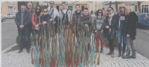
Ekipa Muzeja antičkog stakla, kulturne atrakcije godine