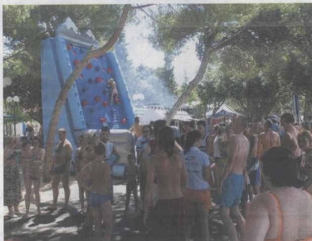
Kamp Straško, Novalja – kamp godine