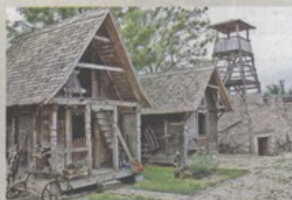
Ulica zaboravljenog vremena u Baranjskoj kući u Karancu