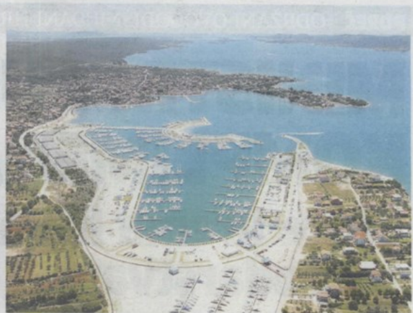
Najbolja marina u Hrvatskoj - D-Marin Dalmacija, Bibinje - Sukošan