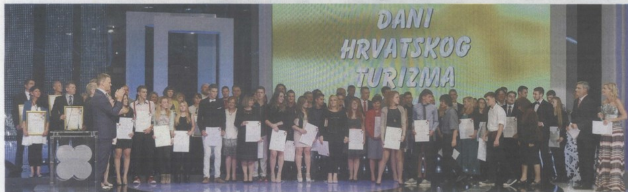
Nagrađeni na Danima hrvatskog turizma