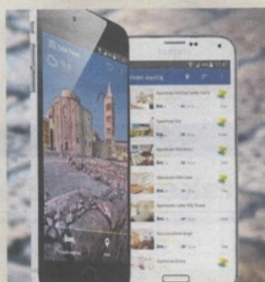
Aplikacija »Zadar Travel«