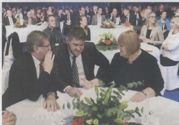
Zbog nagrada je u Poreč došlo nekoliko ministara

Kako smo već i obavještavali naš ovogodišnji predstavnik u europskom natjecanju EDEN je Gornje Međimurje. Hrvatske turističke nagrade nije dobio ni jedan pojedinac s ovog područja.