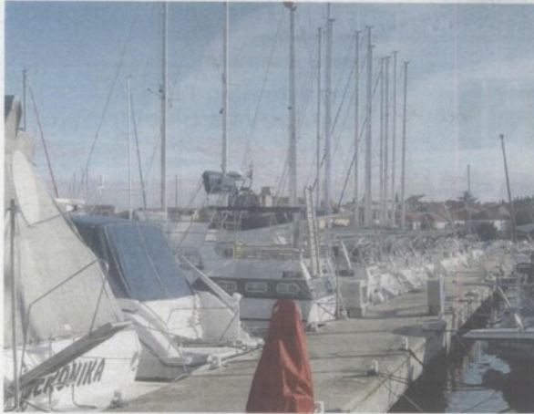
Angelina Tours d.o.o., Biograd n/m - charter godine