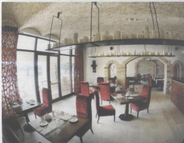
Luksuzni hotel - 1. mjesto Hotel Monte Mulin, Rovinj