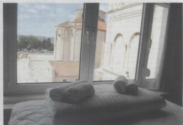
Turishotelov Boutique Hostel Forum, Zadar - hostel godine

Poslovni hotel – 1. mjesto Esplanade Zagreb Hotel, Zagreb Kongresni hotel – 1. mjesto Radisson Blu Resort, Split Odmorišni hotel – 1. mjesto Hotel Dubrovnik Palace, Dubrovnik Wellness hotel – 1. mjesto Casino Hotel Mulinu, Bujе Mali i prijateljski hotel – 1. mjesto Hotel Waldinger, Osijek Luksuzni hotel – 1. mjesto Hotel Monte Mulinu, Rovinj