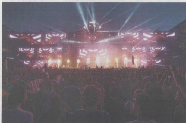
Turistički događaj godine – Festival Ultra Europe – Split, Poljud