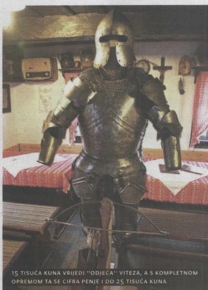
15 TISUĆA KUNA VRIJEDI "ODJEĆA" VITEZA, A S KOMPLETNOM OPREMOM TA SE CIFRA PENJE I DO 25 TISUĆA KUNA

"Ozljede nas ne obeshrabriju, svi smo još uvijek tu". No, osim što je skupo, bome je i opasno. Iako im, kažu, nije trebalo puno vremena da bi borbe