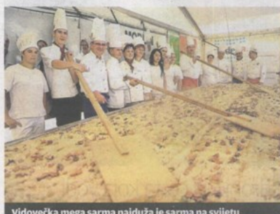
Vidovečka mega sarma najduža je sarma na svijetu

U Lepoglavi se tako večeras otvara 18. međunarodni festival čipke koji će trajati sve do nedjelje. U sklopu festivala posjetitelji će, između ostalog, moći vidjeti izložbu replika nakita, ukrasnih predmeta i novca bosanskih kraljeva iz sarajevskog Zemaljskog muzeja te izložbu Nakičeno, nenaikičeno, koja će predstaviti čipku na ženskom modnom priboru od 1800. do 1900. godine. Jedno od posebno atraktivnih događanja bit će i predstavljanje čipke na tilu iz Lijera. Osim u ljepoti čipke, ovih dana se u varaždinskom kraju može uživati i u zvucima barokne glazbe. Sutra se, naime, u varaždinskoj katedrali otvaraju 44. Barokne večeri. Ove godine zemlja partner festivala je Italija, pa će tako festival i otvoriti svjetski poznat talijanski ansambl Accademia Bizantina uz varaždinski zbor Chorus Angelicus. Ulaznice za otvorenje već su odavno rasprodane, ali ono će se uživati moći pratiti