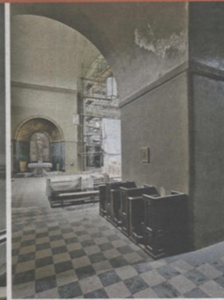
Znamenita armirano-betonska kupola promjera je oko 25 metara (lijevo); u drugoj fazi uređenja, za koje se također prikupljaju donacije, na red će doći obnova zidova koji su u lošem stanju (gore)