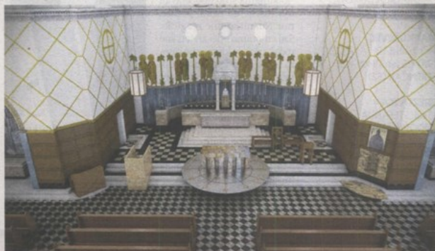
3D simulacija osuvremenjenog Kovačićeva projekta prikazuje svetište koje će biti dovršeno za Božić

- Nije bilo novca za završetak uređenja interijera upravo zbog početka rata. Čak se i lim sa znamenite kupole