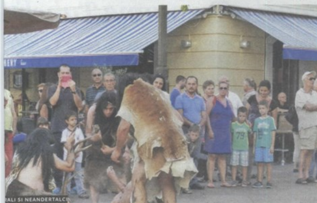
VALI SI NEANDERTALCI