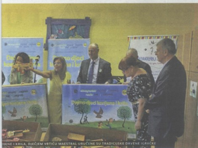
BIJENE I KRILA, DJEČJEM VRTIČU MAESTRAL URUČENE SU TRADICIJSKE DRVENE IGRAČKE