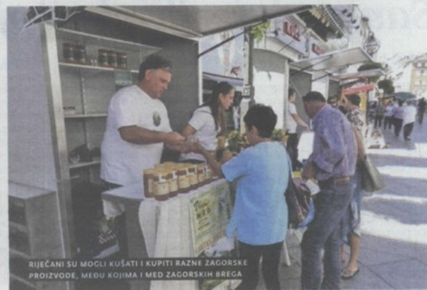
RIJEČANI SU MOGLI KUŠATI I KUPITI RAZNE ZAGORSKE PROIZVODE, MEĐU KOJIMA I MED ZAGORSKIH-BREGA

Press CLIPPING d.o.o., tel.: +385 (0)1 / 3094804, e-mail: press@pressclip.hr, www.pressclip.hr Korisnik usluga ne smije dalje reproducirati i / ili distribuirati dostavljene mu Programske sadržaje medija bez posebnog odobrenja Nositelja prava (DZMAP i HDS-ZAMP)