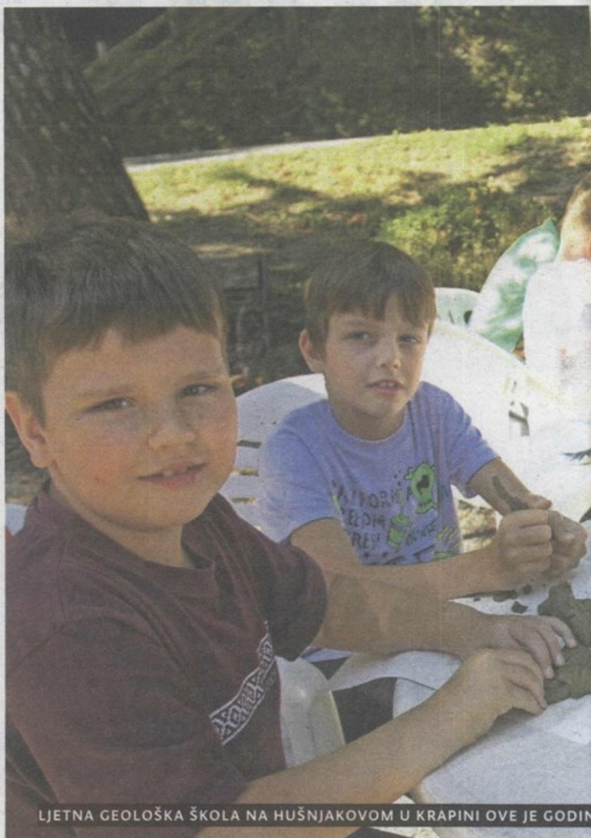
LJETNA GEOLOŠKA ŠKOLA NA HUŠNIAKOVOM U KRAPINI OVE JE GODINE

KRAPINA - Ljetna geološka škola u Krapini koja se održava svake godine u zadnjem tjednu kolovoza i namijenjena je djeci predškolske dobi i učenicima osnovnih škola s ciljem popularizacije geološke i paleontološke djelatnosti ove je godine pobudila izuzetno veliki interes mališana iz cijele Hrvatske. Njih 60-ak uživalo je na različitim radionicama na temu geologije i paleontologije. Djeci su se svidjele likovne radionice, radionice modeliranja pomoću gline i igre vezanih uz popularne dinosaure, a posebno terenska nastava gdje su pomoću geološke opreme tražili fosile i minerale i proučavali stijene. Upoznali su se s muzejskim zbirkama, obišli nalazište Hušnjakovo , postav Muzeja krapinskih neandertalaca , jezero Dolac gdje su pronašli fosilne školjke, a u malom geološkom laboratoriju poput pravih znanstvenika pomoću mikroskopa i lupu proučavali su fosile koje su sami pronašli. Edukativna igra u prirodi prije početka nove školske godine klincima je svidjela i nestrpljivo čekaju novo izdanje. Organizator Ljetne geološke škole je Muzej evolucije i nalazište krapinskog pračovjeka Hušnjakovo . (M. Bašak)