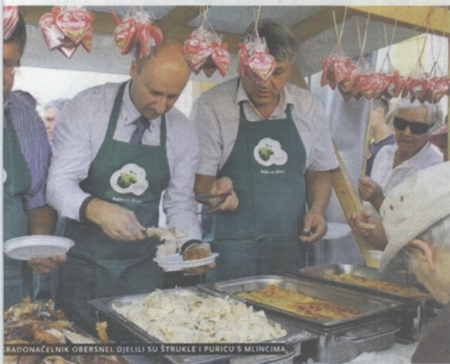
BRADONAČELNIK OBERSNEL DJELILI SU ŠTRUKLE I PURICU S MLINCIMA

odijeljeno je 500 porcija zagorskog purana s mlincima i oko 700 štrukli