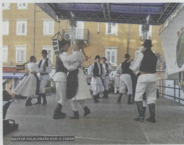
NASTUP FOLKLORAŠA KUD-A ZABOK