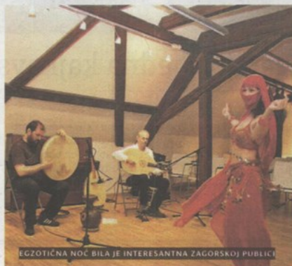
EGZOTIČNA NOĆ BILA JE INTERESANTNA ZAGORSKOJ PUBLICI