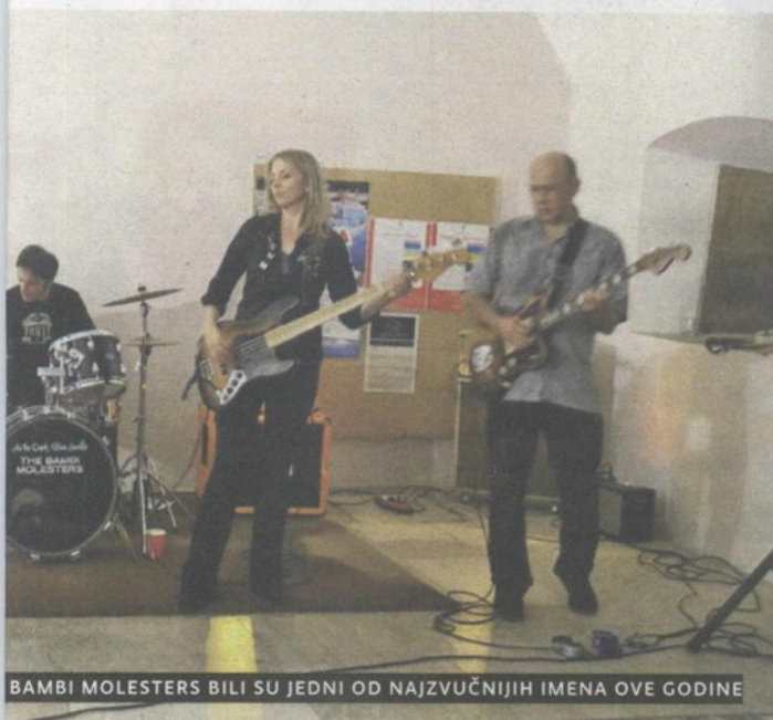
BAMBI MOLESTERS BILI SU JEDNI OD NAJZVUČNIJIH IMENA OVE GODINE

lio Stubicom i Hrvatskom glazbenom mladeži