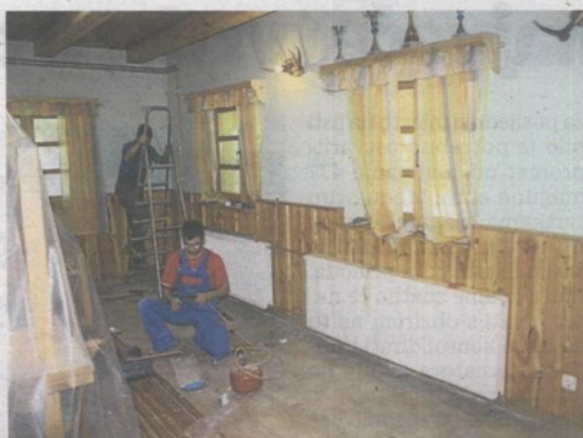
Radovi na unutarnjem uređenju zgrade Lovačkog doma

Lovački dom u Cerju Jesenjskom, kojim upravlja lovačko društvo "Kuna" Jesenje, ovih je dana veliko gradilište. Izvode se radovi na uređenju toplinske fasade, postavlja se krovna toplinska izolacija, a na tavanjskom dijelu prostora izvode se završni radovi;