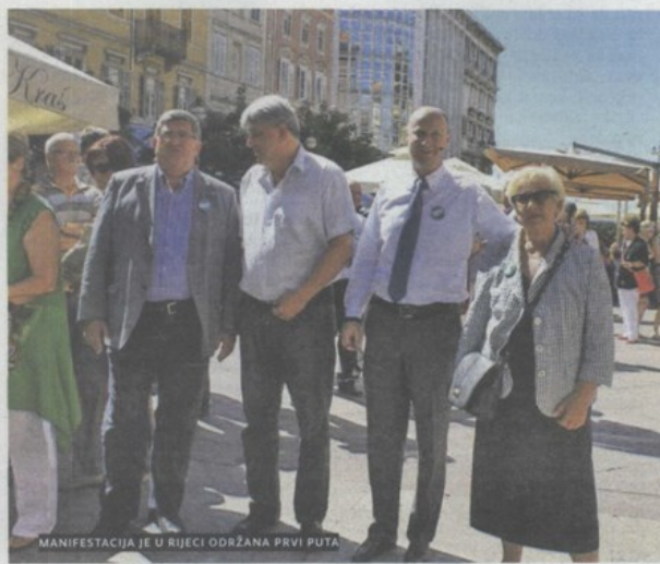
MANIFESTACIJA JE U RUJEVI ODRŽANA PRVI PUTA