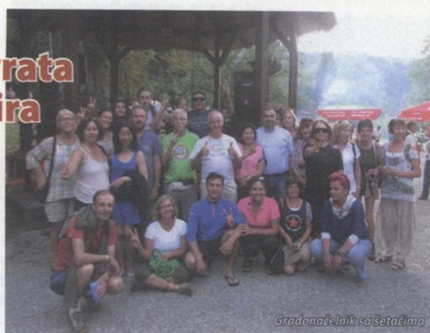
Gradonačelnik sa šetačima

destinacija, turistički nerazvijenih krajeva, a znamo kako je hostel najjeftinija varijanta smještaja – rekla je Marlis Vučajnk, vlasnica prvog krapinskog hostela. Hodače su u Krapini dočekali neandertalci , a imali su prilike uživati u programu manifestacije Ljeto u Krapini , te običi znamenitosti našeg grada. Iz Beča je putem Trsta krenulo 125 šetača, no zbog velike zahtjevnosti pothvata, trećina šetača prekinula je putovanje, dok ostali nastavljaju svoju šetnju i pritom se