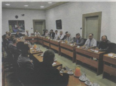
Gli imprenditori delle due regioni si sono incontrati alla Camera d'economia