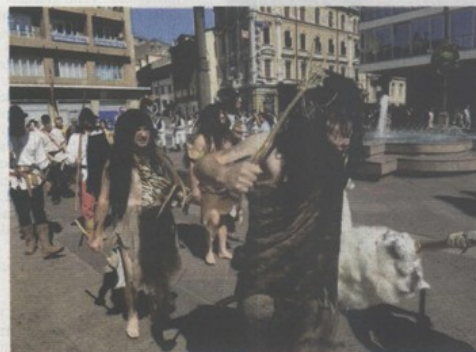
L'uomo di Neanderthal da Krapina a Fiume