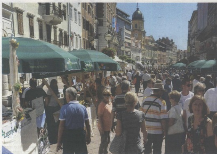
La fiera "100 per cento dello Zagorje" ha occupato il Corso