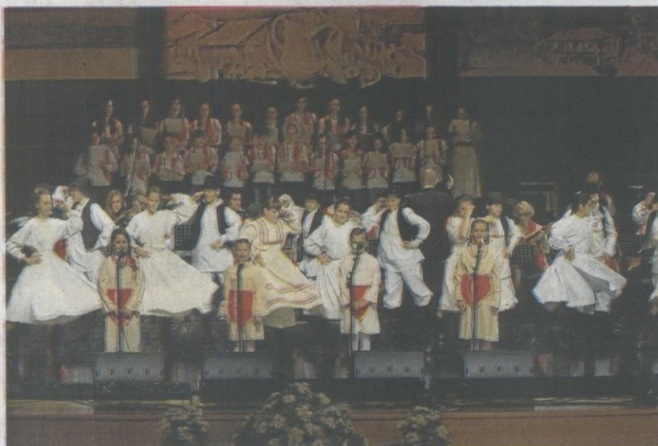
Najmlađi kajkavci na krapinskoj pozornici njeguju stoljetnu tradiciju

- Festival ima ambijentalnu i svaku drugu posebnost, izvođači nastupaju u narodnim nošnjama, a ono što me posebno veseli je veliki revijski orkestra s vrhunskim glazbenicima koji prakti izvođače - kaže Leopold.