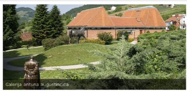
Galerija antuna augustinčića

Dvadeset milijuna kuna odobreno je projektu Studio Galerije Antuna Augustinčića za sufinanciranje sredstvima iz EU fondova