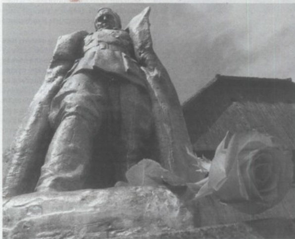
Tito u Kumrovcu shvaćaju kao turističku atrakciju

Prema njegovim riječima, projekt podržava i DUUDI, ali ima i značajnu potporu kumrovečkog zeta – ministra SINIŠE HAJDAŠA DONČIĆA. Najnovijim potezima, nastavlja Ulama, država je napokon odustala od dugogodišnje politike zanemarivanja Kumrovcu kojeg su zbog nekretnina iz Titova doba obilazili mnogi potencijalni ulagači. Primjerice, saudijski investitor koji je došao preko Ingre bio je zainteresiran za preuzimanje zgrade Političke škole i Spomen doma boraca i pokazivao je i neke skice pozivajući se na sudjelovanje u projektu Burj el Arab, hotela – jedra sa sedam zvjezdica u Dubaiju. Kada je saudijski investitor 'odjedrio' nakon potapanja Ingre, interes su pokazali i Kinezi kojima je predstavljeno i moguće ulaganje u prenamjenu bivše političke škole u centar akupunkture,