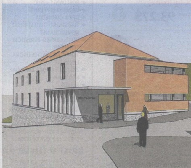
Idejno rješenje buduće Augustinčićeve čuvaonice u Klanjcu

Muzeji Hrvatskog zagorja prijavili su u veljači projekt izgradnje nove čuvaonice Galerije Antuna Augustinčića u Klanjcu i program aktivnosti Studio GAA na javni poziv u okviru Operativnog programa Regionalna konkurentnost 2007 – 2013. Ovih je dana pristigla odluka da je projekt kojeg je prijavila bivša ravnateljica Muzeja Goranka Horjan, odabran za financiranje. - Unesene su vrlo male korekcije u izvornu prijavu