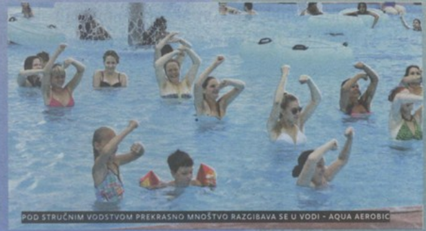
POD STRUČNIM VODSTVOM PREKRASNO MNOŠTVO RAZGIBAVA SE U VODI - AQUA AEROBIC