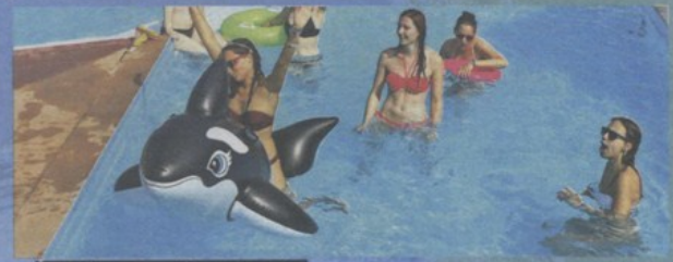
ČISTA UŽIVANCIJA NA VODENOM PLANETU