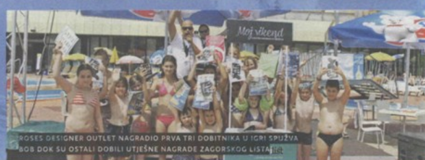
ROSES DESIGNER OUTLET NAGRADIO PRVA TRI DOBITNIKA U IGRI SPUŽVA BOB DOK SU OSTALI DOBILI UTJEŠNE NAGRADE ZAGORSKOG LISTA