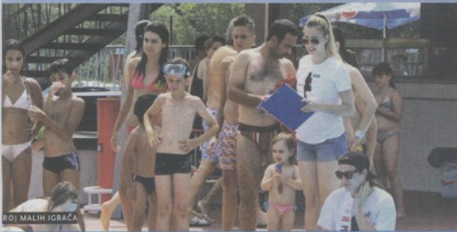
ROJ MALIH IGRAČA