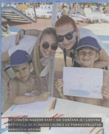
UZ STRUČNI NADZOR SARE I IDE ODRŽANA JE I LIKOVNA RADIONICA ZA KLINCEZE I KLINCE UZ POKROVITELJSTVO NARODNIH NOVINA