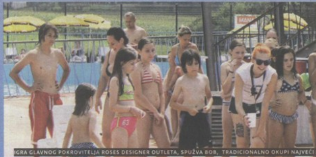
IGRA GLAVNOG POKROVITELJA ROSES DESIGNER OUTLETA, SPUŽVA BOB, TRADICIONALNO OKUPI NAJVEĆI