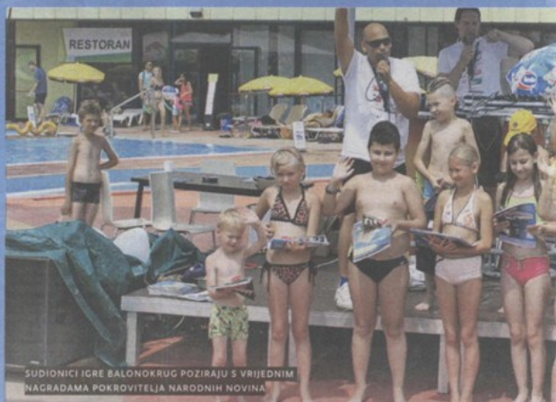
SUDIONICI IGRE BALONOKRUG POZIRAJU S VRIJEDNIM NAGRADAMA POKROVITELJA NARODNIH NOVINA