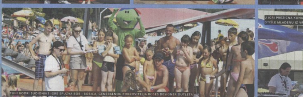
TUHI BODRI SUDIONIKE IGRE SPUŽVA BOB I BOBICA, GENERALNOG POKROVITELJA ROSES DESIGNER OUTLETA