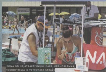
JEDNA OD NAJATRAKTIVNIJIH IGARA, GRAHOSLAMKA POKROVITELJA JE VETROPACK STRAŽE