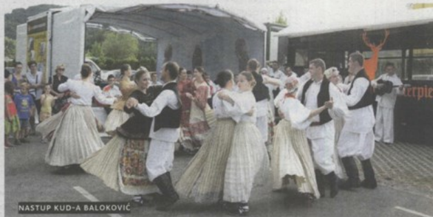
NASTUP KUD-A BALOKOVIĆ