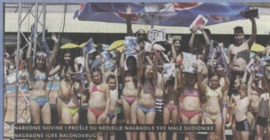
NARODNE NOVINE I PROŠLE SU NEDJELJE NAGRADILE SVE MALE SUDIONIKE NAGRADNE IGRE BALONKRUG