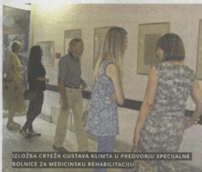
IZLOŽBA CRTEŽA GUSTAVA KLIMTA U PREDVORJU SPECIJALNE BOLNICE ZA MEDICINSKU REHABILITACIJU

ne, koja je već obišla nekoliko gradova u Hrvatskoj, a u predvorju Specijalne bolnice za medicinsku rehabilitaciju bit će postavljena do 17. kolovoza. (S. Pušec)