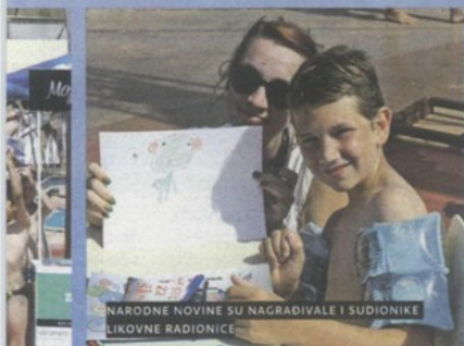
NARODNE NOVINE SU NAGRADIVALE I SUDIONIKE LIKOVNE RADIONICE