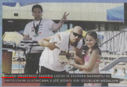
MUZEJI HRVATSKOG ZAGORJA LUCIJU IZ ZAGREBA NAGRADILI SU OBITELJSKIM ULAZNICAMA U JOŠ JEDNOJ IGRI IZGUBLJENI MEDALJON