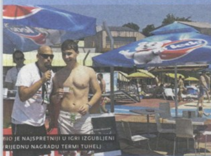
PIO JE NAJSPRETNIJU U IGRI IZGUBLJENI RIJEDNU NAGRADU TERMI TUHELJ