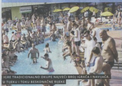
IGRE TRADICIONALNO OKUPE NAJVEĆI BROJ IGRAČA I NAVIJACA. U TIJEKU I TOKU BESKONAČNE RIJEKE