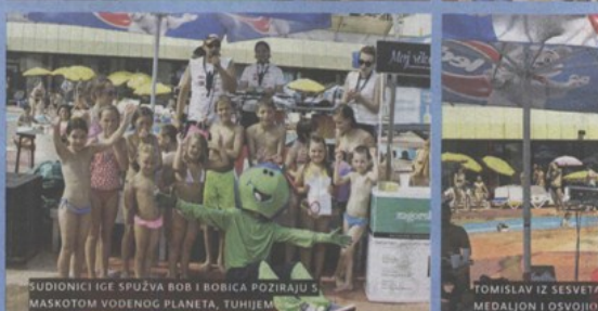
SUDIONICI IGE SPUŽVA BOB I BOBICA POZIRAJU S MASKOTOM VODENOG PLANETA, TUHIJEM