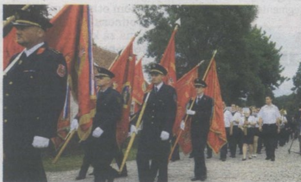
Prisustvovalo je 350 vatrogasaca iz cijelog Zagorja

Gjuro Deželić je, osim u vatrogastvu, bio zapažen i u drugim područjima