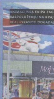
ANIMACIJSKA EKIPA ZAGORSKE RIVIJERE RASPOLOŽENU NA KRAJU REALIZIRANOG DOGAĐAJA