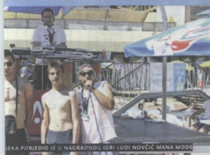
ŠEKA POBJEDIO JE U NAGRADNOG IGRI LUDI NOVČIĆ MANA MODE