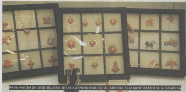
PRVA NAGRADA DODIJELJENA JE UNIKATNOM NAKITU OD SREBRA ZLATARNE BASHOTA IZ ZAGREBA