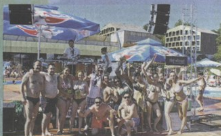
U ŽUJINOJ IGRI POTEZANJE UŽETA EKIPA IZ IVANIC GRADA POBJEDILA JE EKIPU IZ OPATJICE, OSIJEKA I KRIŽEVACA. SVI SU NAGRAĐENI. NARAVNO, ŽUJOM