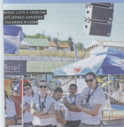
ŠEŠKOG LISTA U VESELOM JOŠ JEDNOG USPJEŠNO ZAGORSKE RIVJERE