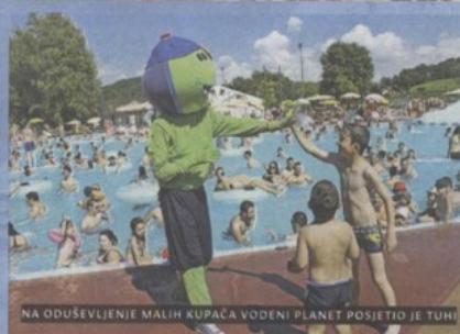
NA ODUŠEVLENJE MALIH KUPACA VODENI PLANET POSJETIO JE TUHELJ