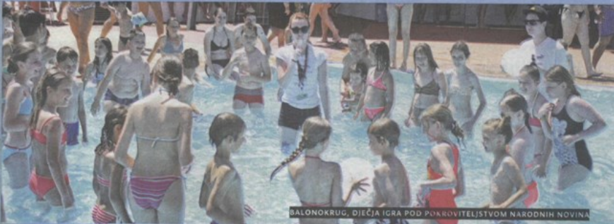
BALONOKRUG, DJEČJA IGRA POD POKROVITELJSTVOM NARODNIH NOVINA