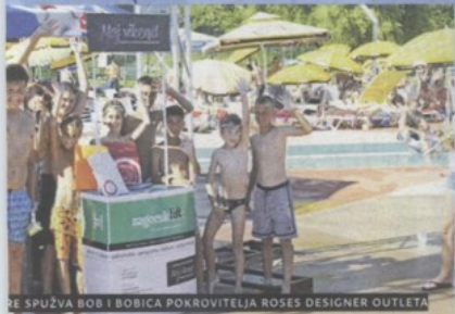
ŠE SPUŽVA BOB I BOBICA POKROVITELJA ROSES DESIGNER OUTLETA