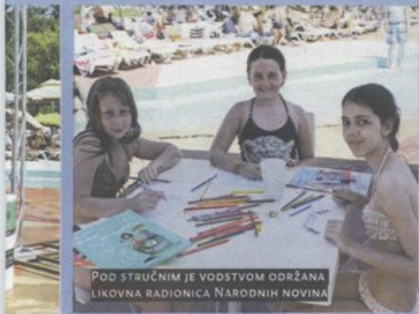
POD STRUČNIM JE VODSTVOM ODRŽANA LIKOVNA RADIONICA NARODNIH NOVINA