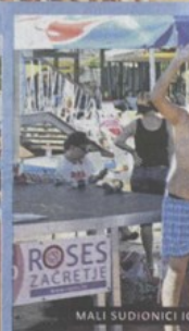
MALI SUDIJOICI IGRE