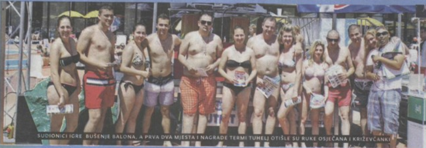
SUDIJOICI IGRE BUŠENJE BALONA, A PRVA DVA MJESTA I NAGRADE TERMI TUHELJ OTIŠLE SU RUKU OSIJEČANA I KRIŽEVČANKI