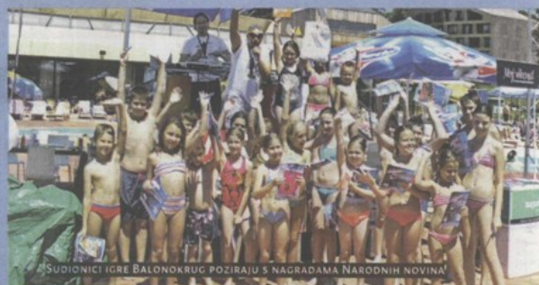
SUDIJOICI IGRE BALONOKRUG POZIRAJU S NAGRAĐAMA NARODNIH NOVINA