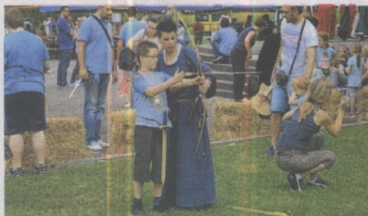
Mali streličar i dvorske dame

Time, ali i brojnim drugim događanjima u kojima se moglo uživati gledanjem i sudjelovanjem svi su na jedan dan ušli u srednji vijek i mogli su isprobavati čarobne napitke srednjovjekovne kuhinje, okušati se u borbama vitezova, gledati ili okušati se u dvorskim plesovima, renesansnoj glazbi i mnogočemu drugome.