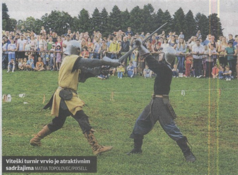
Viteški turnir vrvio je atraktivnim sadržajima

GORNJA STUBICA Na imanju Franje Tahija održan atraktivan 14. Viteški turnir