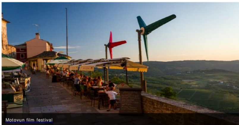
Motovun film festival

f Recommend Sign Up to see what your friends recommend.