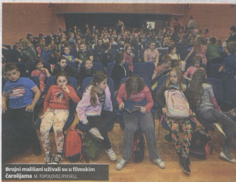
Brojni mališani uživali su u filmskim čarolijama.