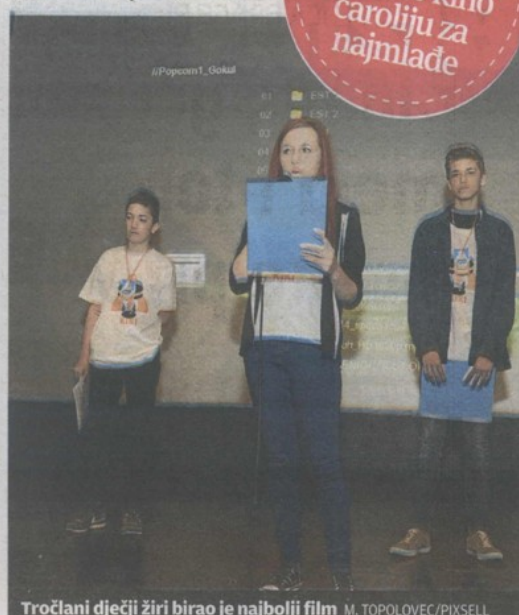
Tročlani dječji žiri birao je najbolji film.

KIKI je i ove godine priredio kino čaroliju za najmlađe