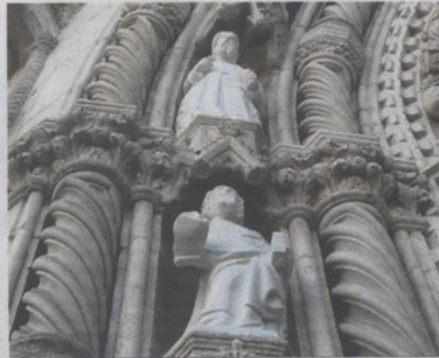
Novoklesani apostoli, kolokvijalno poznati kao šibenski Štumpfovi