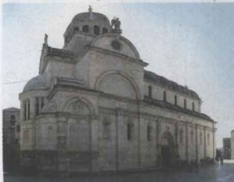
Katedrala sv. Jakova u Šibeniku

Nela VALERJEV OGURLIĆ