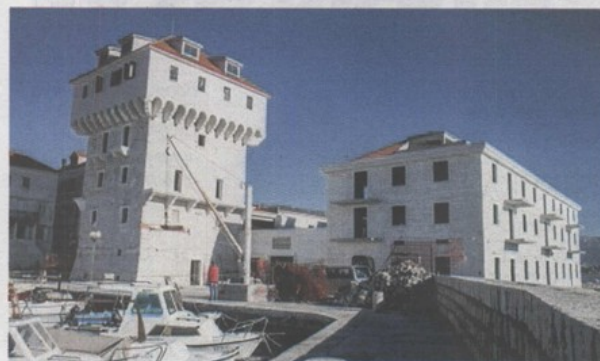
Eklatantan primjer devastacije Kula Cipicco

Tvornički kompleks uključuje više zgrada i vrlo je uspješni urbanistički sklop s interesantnim arhitektonskim kreacijama, a 80 godina