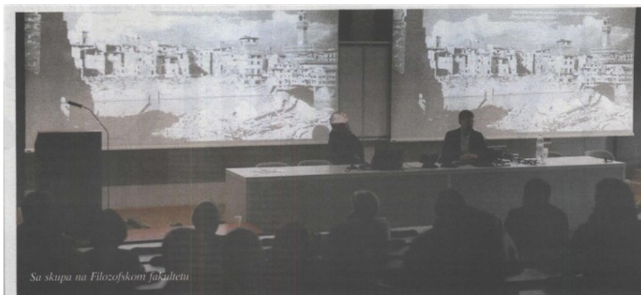
Sa skupa na Filozofskom fakultetu

D evastacija nacionalnih spomenika najveće vrijednosti, onih koji su prepoznati i kao svjetska baština, u Hrvatskoj nije rezultat samo bespravnih intervencija nestručnjaka već jednako tako i pogrešaka koje se događaju pri institucionalnom djelovanju nadležne Uprave Ministarstva kulture. Dok Ministarstvo tolerira slučajeve poput spomenika Kristu koji je zaklonio pogled na glasoviti Radovanov portal, glavni ulaz trogirske katedrale, ne treba se čuditi nelegalnim zahtovima na baštini, jer oni zapravo imaju dozvolu.