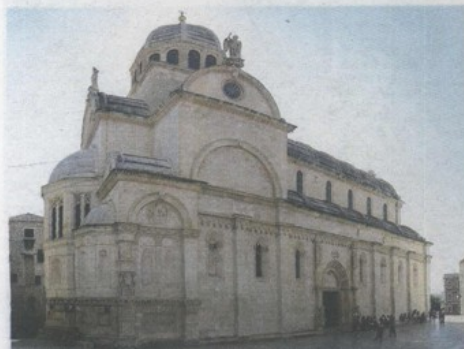
Katedrala sv. Jakova u Šibeniku

Nela VALERJEV OGURLIĆ