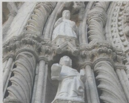
Novoklesani apostoli, kolokvijalno poznati kao šibenski Štumpfovi