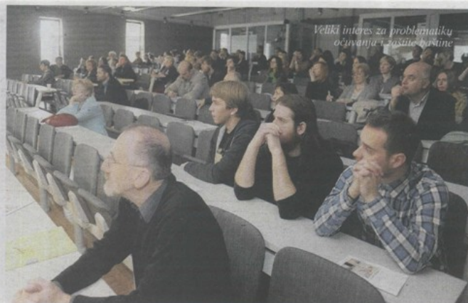
Veliki interes za problematiku očuvanja i zaštite baštine

o je niz povjesničara umjetnosti i konzervatora na temi »Slika spomenika i princip promjene«