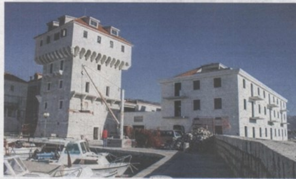
Eklatantan primjer devastacije Kula Cipicco

Tvornički kompleks uključuje više zgrada i vrlo je uspjeli urbanistički sklop s interesantnim arhitektonskim kreacijama, a 80 godina