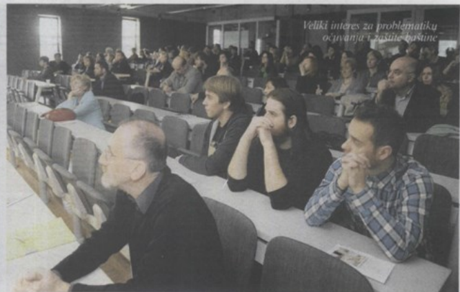
Veliki interes za problematiku očuvanja i zaštite baštine

o je niz povjesničara umjetnosti i konzervatora na temi »Slika spomenika i princip promjene«