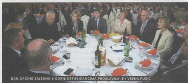
DAN OPĆINE ZAJEDNO S GORNJOSTUBIČANCIMA PROSLAVILA JE I VESNA PUSIĆ

u sredstva za rad udruga. Nakon što su podijeljena javna priznanja, čestitke povodom Dana općine u ime načelnika i gradonačelnika uputio je