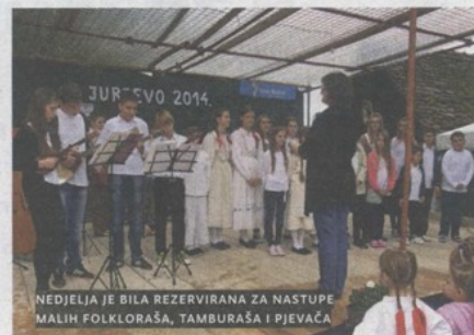
NEDJELJA JE BILA REZERVIRANA ZA NASTUPE MALIH FOLKLORAŠA, TAMBURAŠA I PJEVAČA