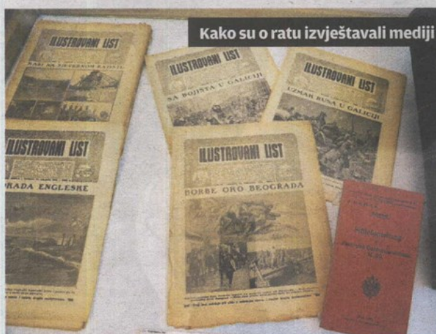
Kako su o ratu izvještavali mediji