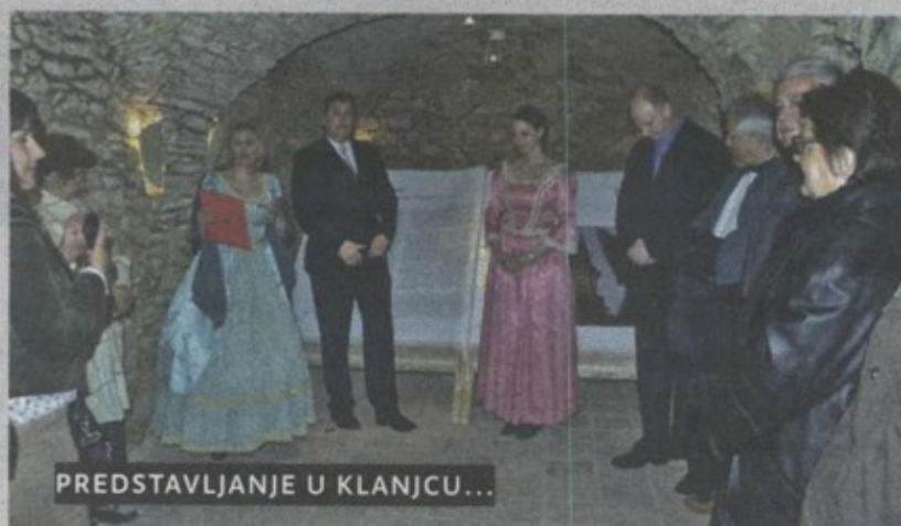
PREDSTAVLJANJE U KLANJCU...