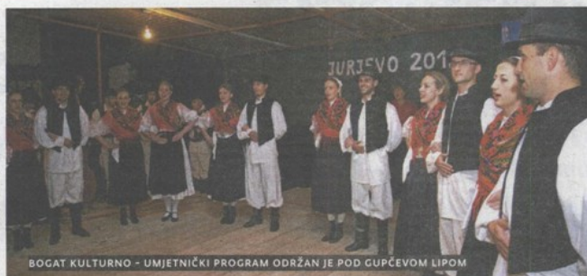
BOGAT KULTURNO - UMJETNIČKI PROGRAM ODRŽAN JE POD GUPCEVOM LIPOM