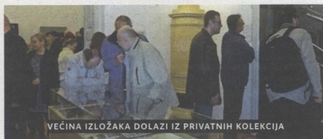
VEĆINA IZLOŽAKA DOLAZI IZ PRIVATNIH KOLEKCIJA

ostali doma, teško je i nemoguće ispričati u službenoj histobiografiji. Upravo zbog toga je važan doprinos naših sugrađana koji su nam ponudili obiteljske priče svojih predaka – istaknula je Horjan jer upravo iz privatnih