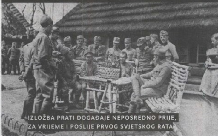
IZLOŽBA PRATI DOGAĐAJE NEPOSREDNO PRIJE, ZA VRIJEME I POSLIJE PRVOG SVJETSKOG RATA

GORNJA STUBICA - Izložba pod nazivom Zagorsko lice boga rata razrađena je prema autorskoj koncepciji muzejske savjetnice Goranke Horjan i kontekstualizira događaje neposredno prije, za vrijeme i poslije Prvog svjetskog rata koji su imali čitav niz posljedica za prostor Hrvatskog zagorja – od političkih preko ekonomskih do društvenih. Na izložbi je radilo više stručnjaka koji su obradili pojedine teme i kataloške jedinice, a još 2013. godine Muzeji Hrvatskog zagorja uključili su se u suradnju s Kućom europske povijesti iz Bruxellesa, te u međunarodnu mrežu muzeja koji obilježavaju sjećanje na prvi globalni sukob, a predvodi je Imperial War Museum iz Londona. Stručni suradnici osim iz Muzeja Hrvatskog