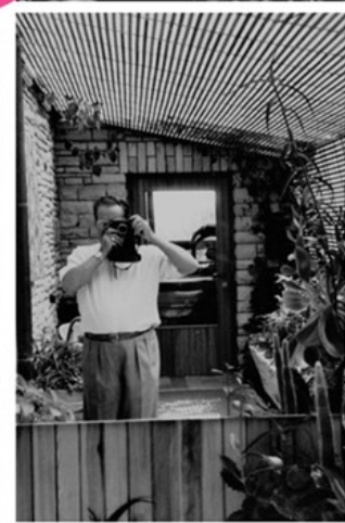
OVAKO SU ME DOČEKALI APARAT JE BIO UZ NJEGA I NA JAVNIM NASTUPIMA