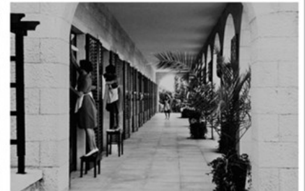
AUTO- PORTRETI SEBE JE FOTOGRAFI- RAO NA BRIJUNIMA MOJE SLUŠKINJE I POSLUGAJE ČESTO BILAU KADRU PRIZORI IZ SVAKO- DNEVICE POSEBNO JE VOLIO SITNICE I Z KUĆANSTVA