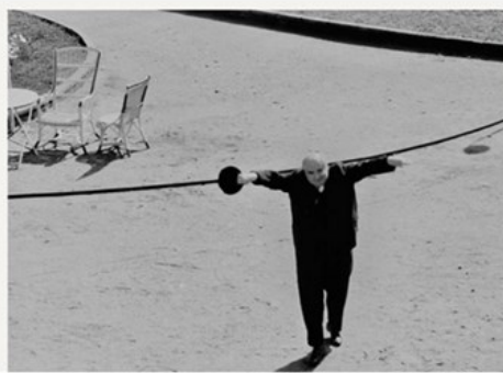
MIROSLAV IBELA KRLEŽA POZNATI KNJIŽEVNIK BIOMUJE ČESTI MODEL