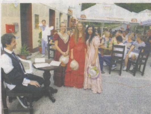
Na Hušnjakovu TZ priređuje program za posjetitelje

Krapina kao kulturno političko središte ima bogatu kulturnu baštinu. Upravo je ona uzeta kao baza za novi turistički proizvod u gradu Krapini. Turistička zajednica Krapine je na natječaj Hrvatske turističke zajednice prijavila projekt "Krapina kroz deset priča". Ovih